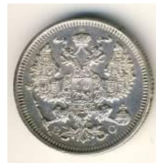
20 копеек 1917 года