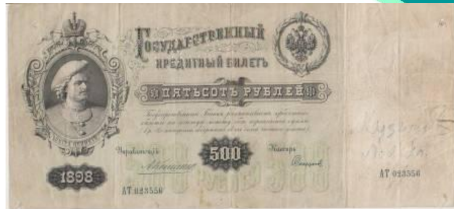
500 рублей 1898 года