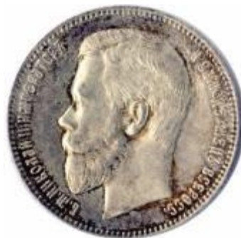
1 рубль 1898 года