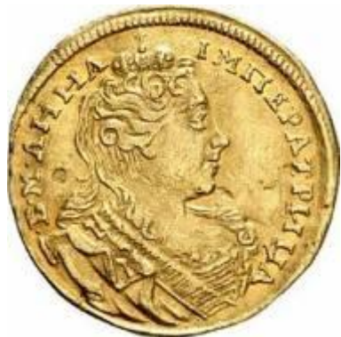
Червонец 1730 года