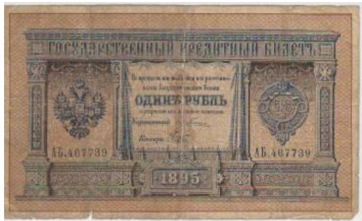
1 рубль 1895 года