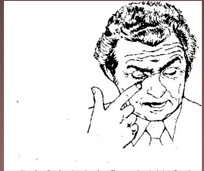
Рис. 53. Потирание века пальцем.

Если собеседник прикрывает рукой рот, большой палец прижат к щеке – это один из наиболее явных признаков лжи. Менее заметный признак – почесывание или поглаживание своего носа. О лжи может свидетельствовать и потирание века.