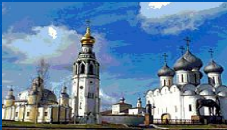
Спасо - Прилуцкий монастырь