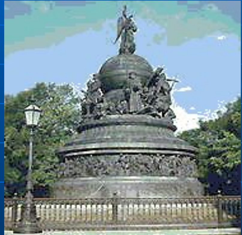
Памятник «Тысячелетие России»