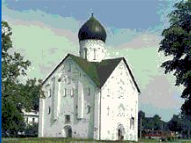
Церковь Спаса Преображения На Ильине