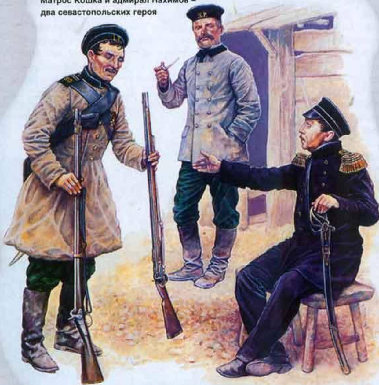
Матрос Кошка и адмирал Нахимов – два севастопольских героя