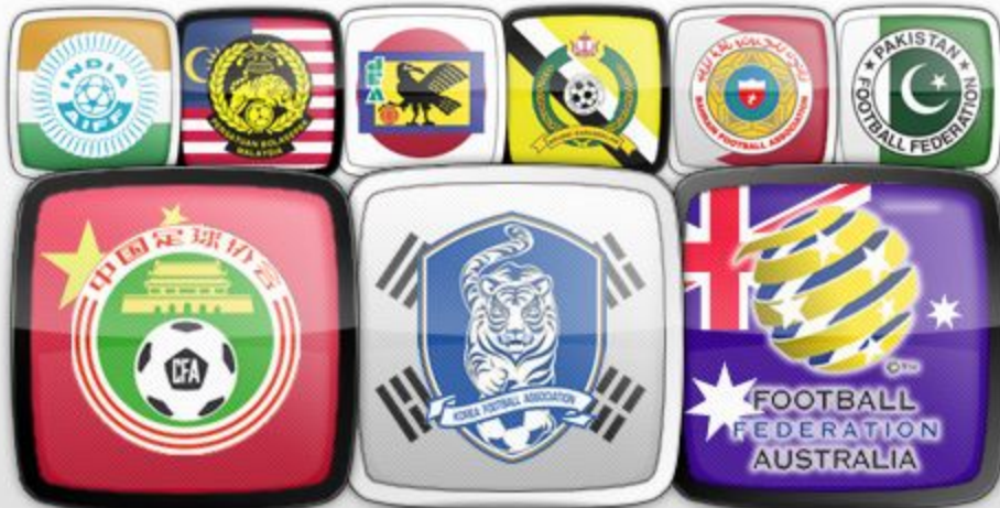
Nations - Asie