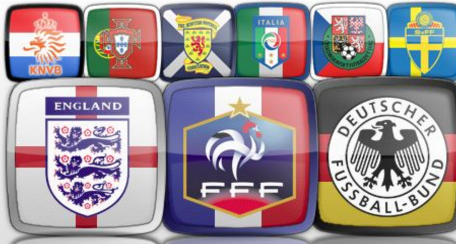
Nations - Europe