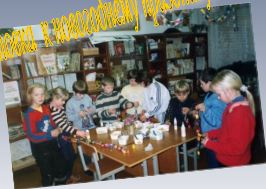
Дружная подготовка к новогоднему празднику.