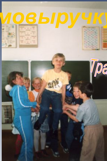
Традиционный "День именинника"