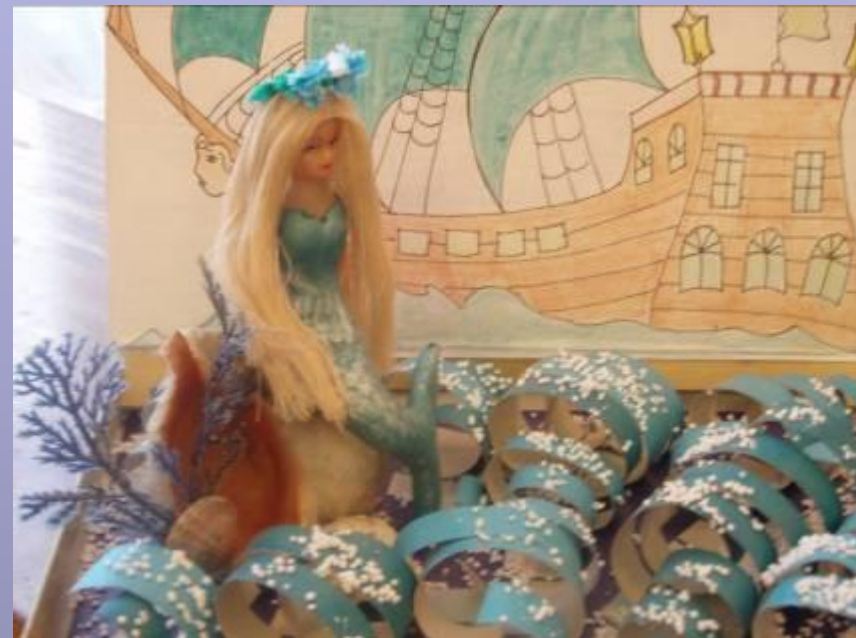
Экспонат “Музея сказок”