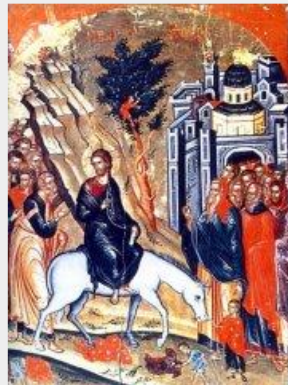
Вход Господень в Иерусалим