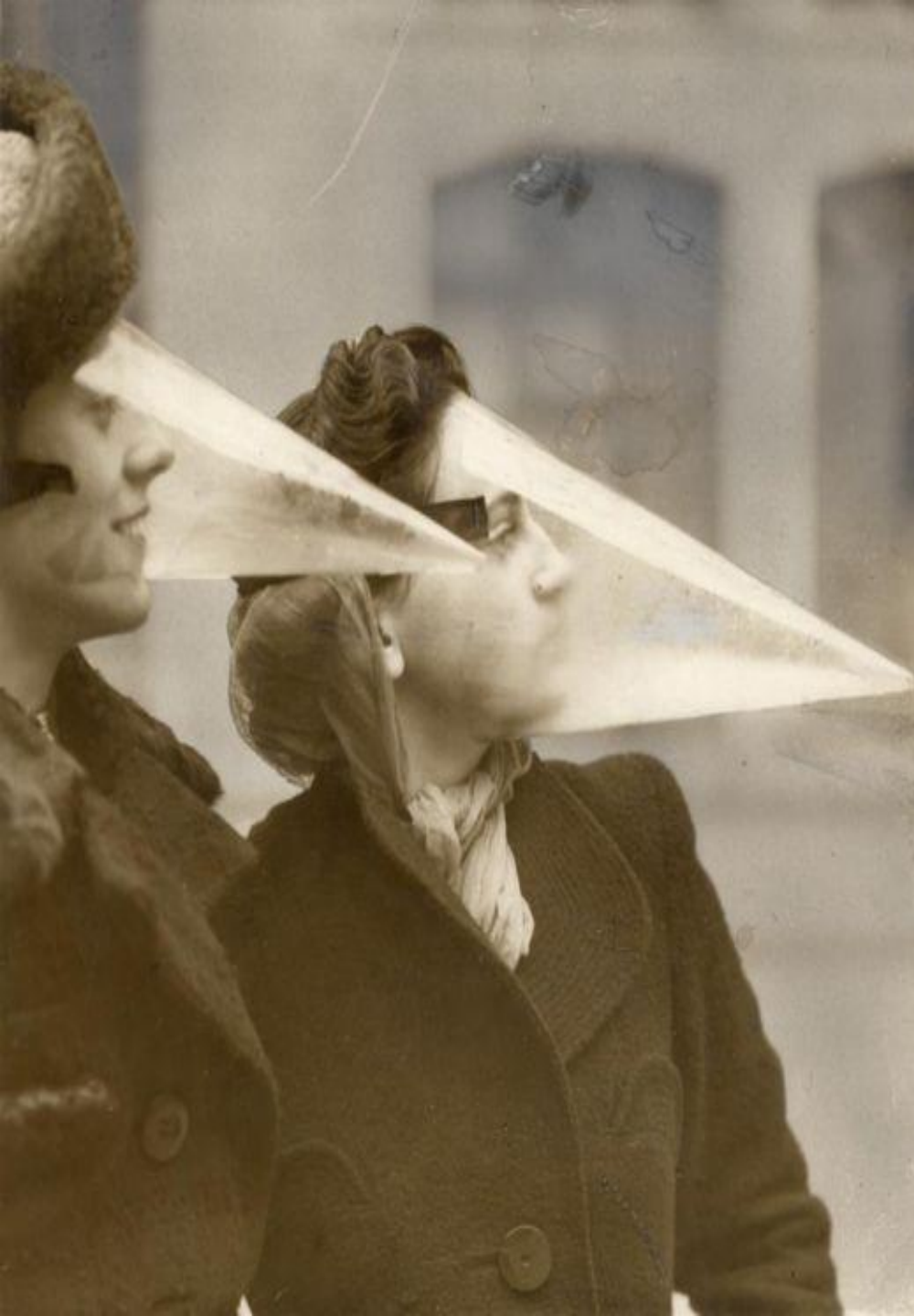
Защитная маска на случай метели (Канада, 1939)