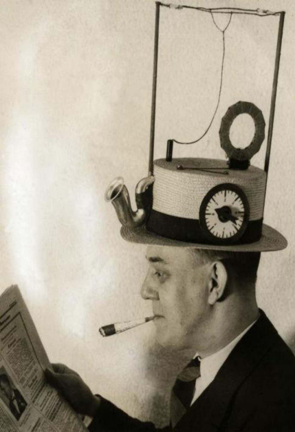
Шляпа-радио (США, 1931).