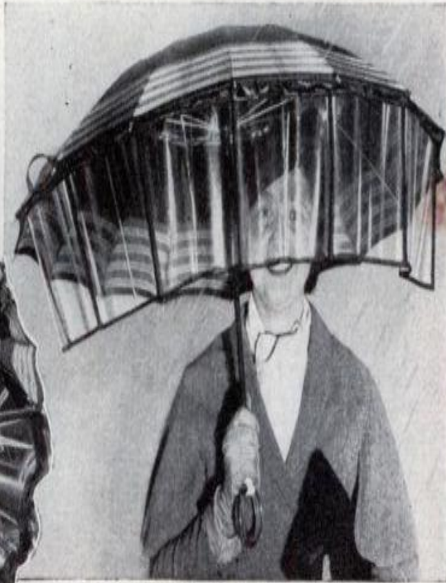
Umbrella with transparent shield in place for use in a driving rain. The photograph at the left shows how the sections fold inside the cover when not in use

Зонт с «лобовым стеклом» на случай дождя с ветром (США, 1936).