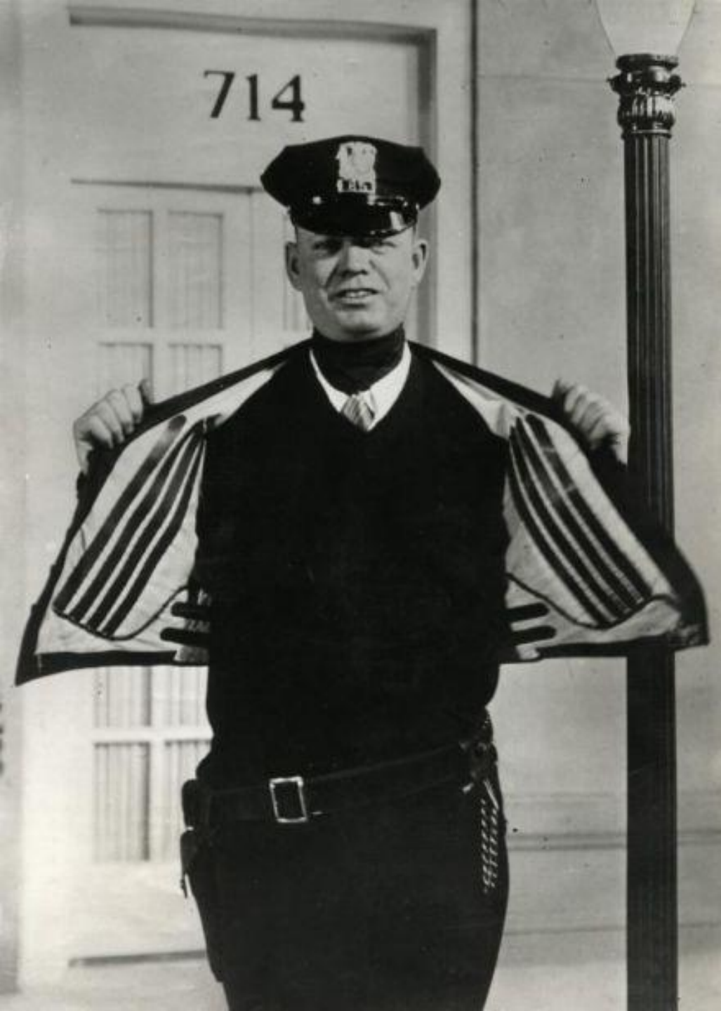
Куртка с электроподогревом (США, 1932).