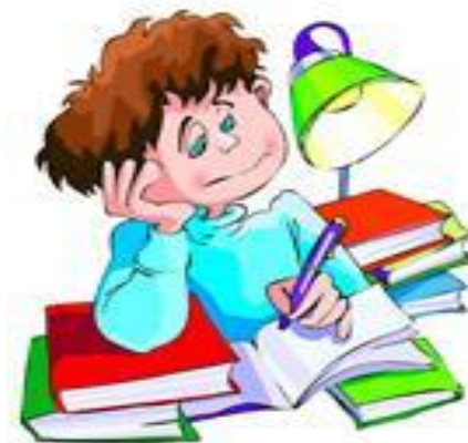
Подготовка к урокам