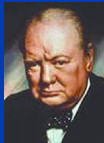
Уинстон Черчилль, британский политик XX века

Политика так же увлекательна, как война. Но более опасна. На войне вас могут убить лишь однажды, в политике - множество раз