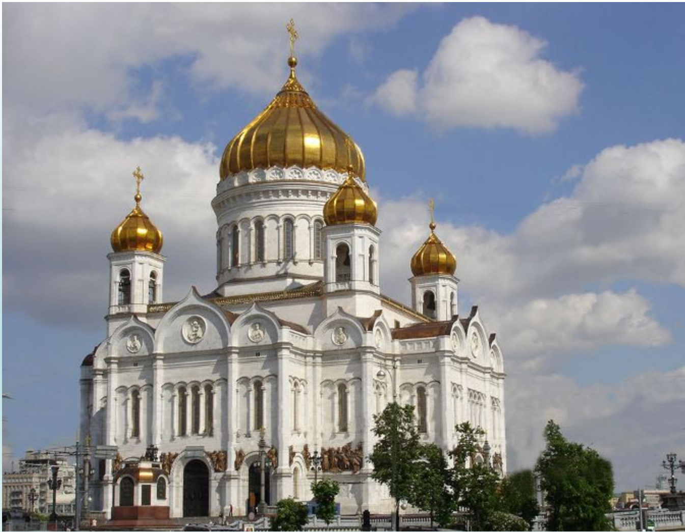
Храм Христа Спасителя (1829 -1883 г.г)