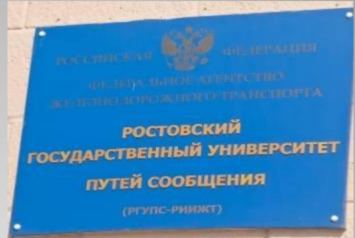
ВЫСШЕЕ УЧЕБНОЕ ЗАВЕДЕНИЕ РОСТОВСКОЙ ЖЕЛЕЗНОЙ ДОРОГИ