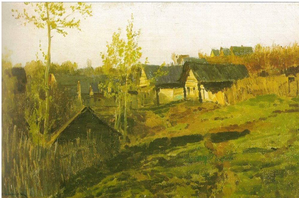
«Деревня. Серый день».