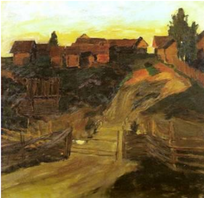
«Последние лучи солнца», 1899 год Государственная Третьяковская галерея