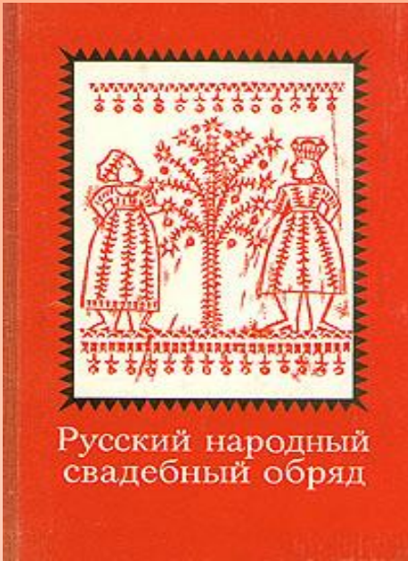
Русский народный свадебный обряд

Как по обрядам русичей начиналась семейная жизнь молодых? Сейчас мало кто помнит, что в мифах седой старины это торжество символизировало небесный брак Месяца и Солнца. Причем Месяц выступал в роли жениха, а Солнце - невесты. С другой стороны, в обрядах свадьбы отражена мысль о плодородии природы и продолжения рода. В память о солнечных культах невесты украшали свой наряд красными лентами. Кроме того, красный цвет считался цветом очистительной магии, хранил невесту от сглаза и колдовских чар. Обычай обмениваться обручальными кольцами тоже возник задолго до христианства. Кольцо - языческий знак Солнца. Древние римляне, германцы, славяне, индусы тоже обменивались кольцами на свадебных церемониях.