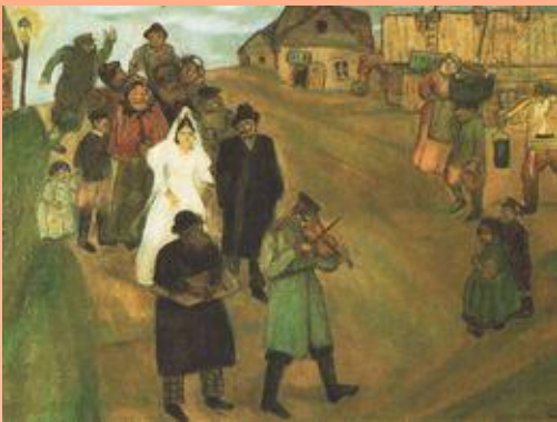
Жених и невеста, Орловская губ., Брянский у., 1908