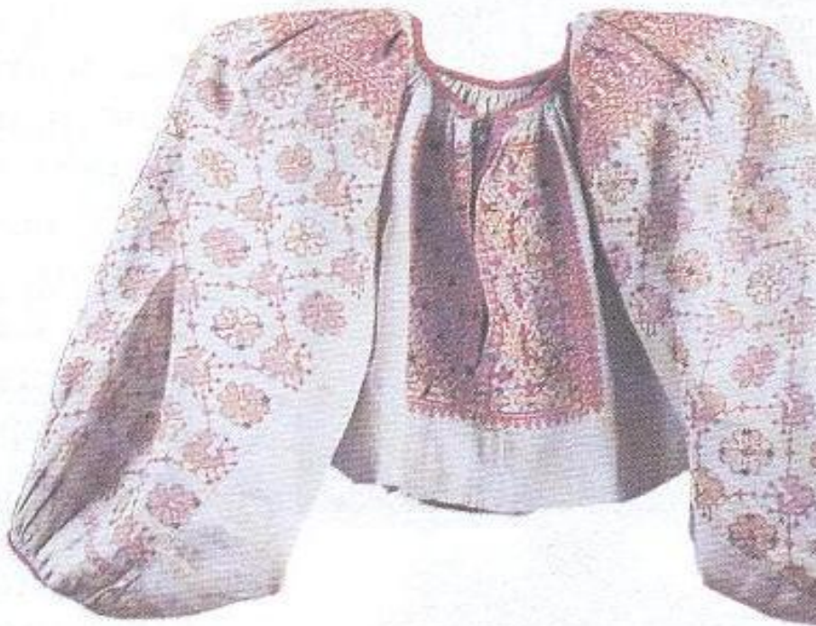
Вышитая женская рубаша