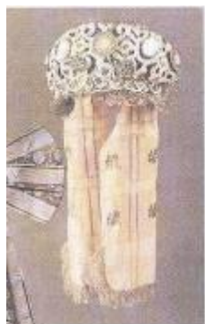
Коруна. Девичий свадебный головной убор. Вологодская губ., 19 в.