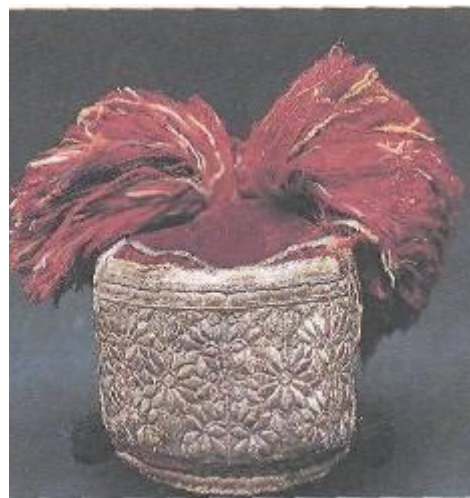
Женский головной убор «сорока с мохрами» Орловская губерния, 19 в.