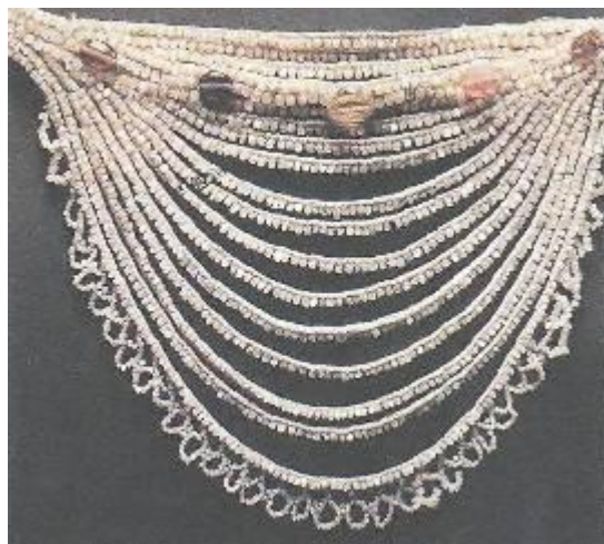
Нагрудное украшение «ожерелок»