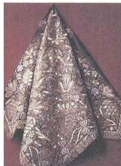
Женский платок. Русский Север, 19 в.