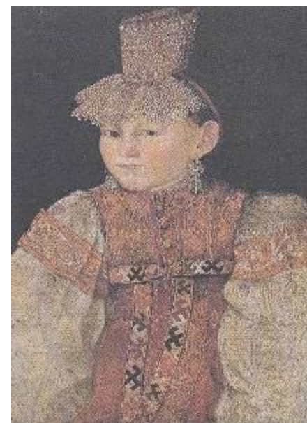
Девушка в праздничном тверском костюме, 19 в.