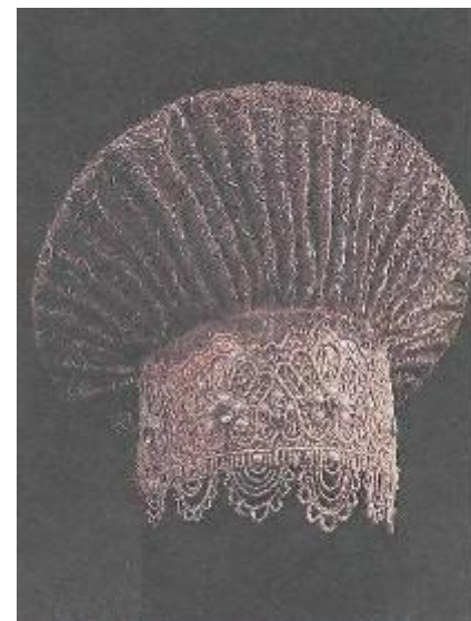
Женский головной убор «сборник». Вологодская губ., 19 в.