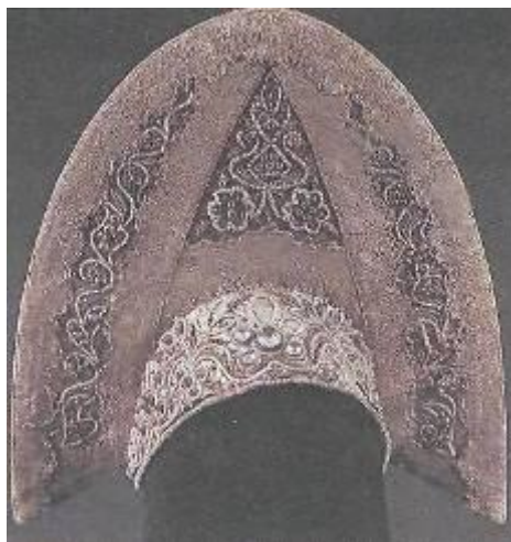
Женский головной убор «кокошник». Нижегородская губ., 19 в.