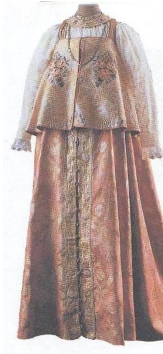
Рубаха, сарафан, епанечка