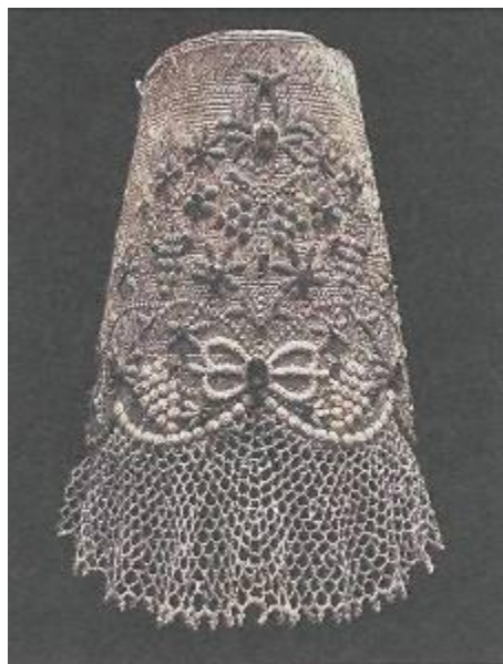
Девичий головной убор «повязка». Нижегородская губ., 19 в.