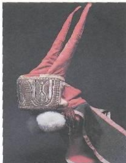
Женский головной убор «сорока» с рогатой «кничкой». Тамбовская губ., 19 в.