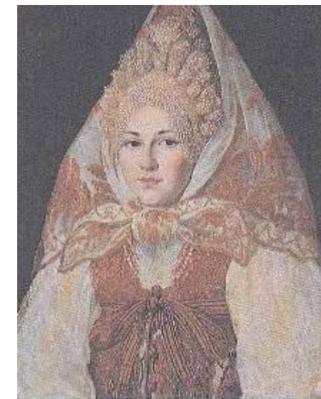
Женщина в кокошнике и платке. Псковская губ, 19 в.