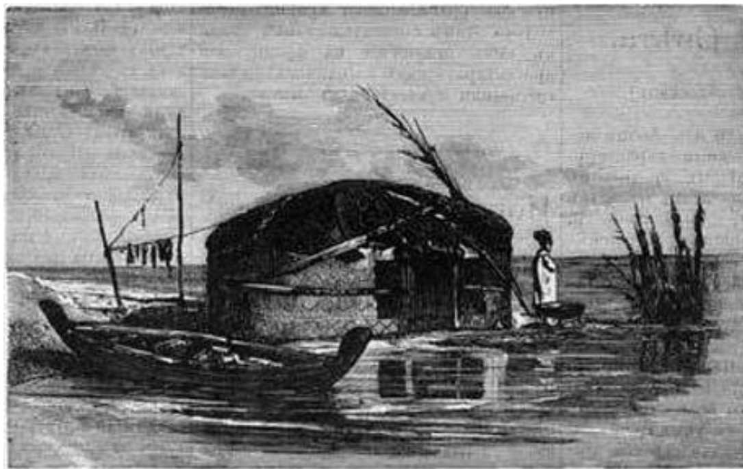
Аральское море: Рыбная ставка киргизовъ.

ГЛАВНЫМИ РЕГИОНАМИ ВЫЛОВА РЫБЫ НА ТЕРРИТОРИИ РОССИЙСКОЙ ИМПЕРИИ БЫЛИ АРАЛЬСКОЕ, КАСПИЙСКОЕ И ЧЕРНОЕ МОРЯ. ОНИ СОСТАВЛЯЛИ 80,2% ВСЕЙ ДОБЫЧИ РЫБЫ СТРАНЫ.