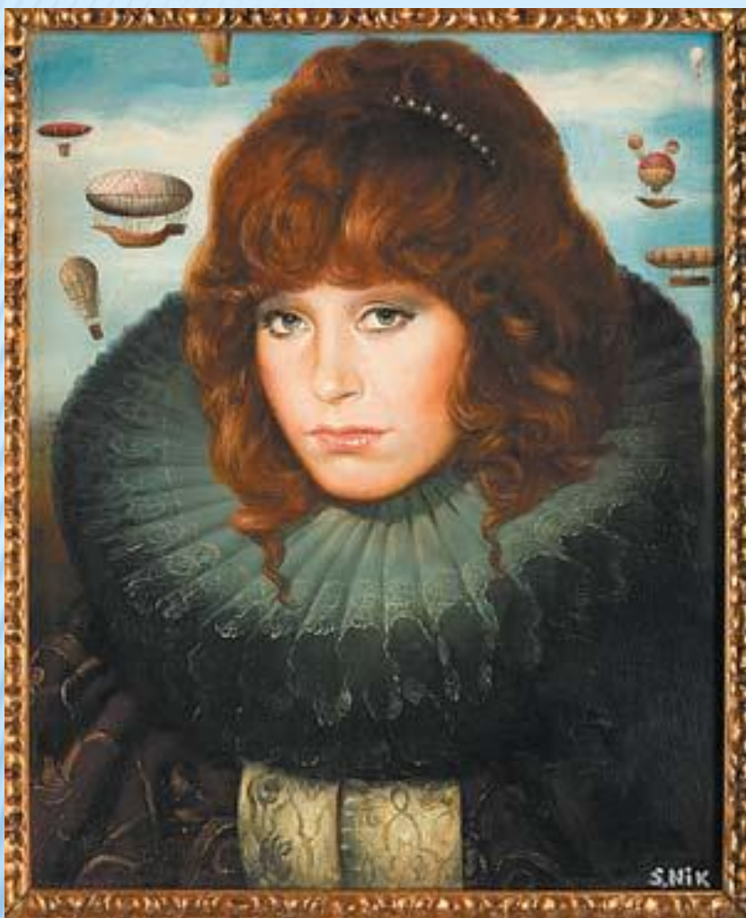
Этот портрет Примадонны Никас Сафронов назвал «Арлекино истории» (1998)