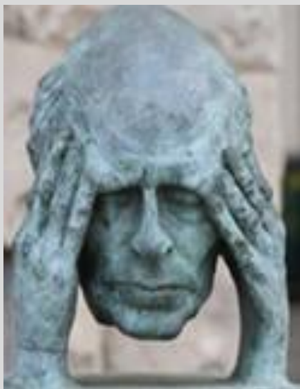
Памятник А. Д. Сахарову в Вашингтоне