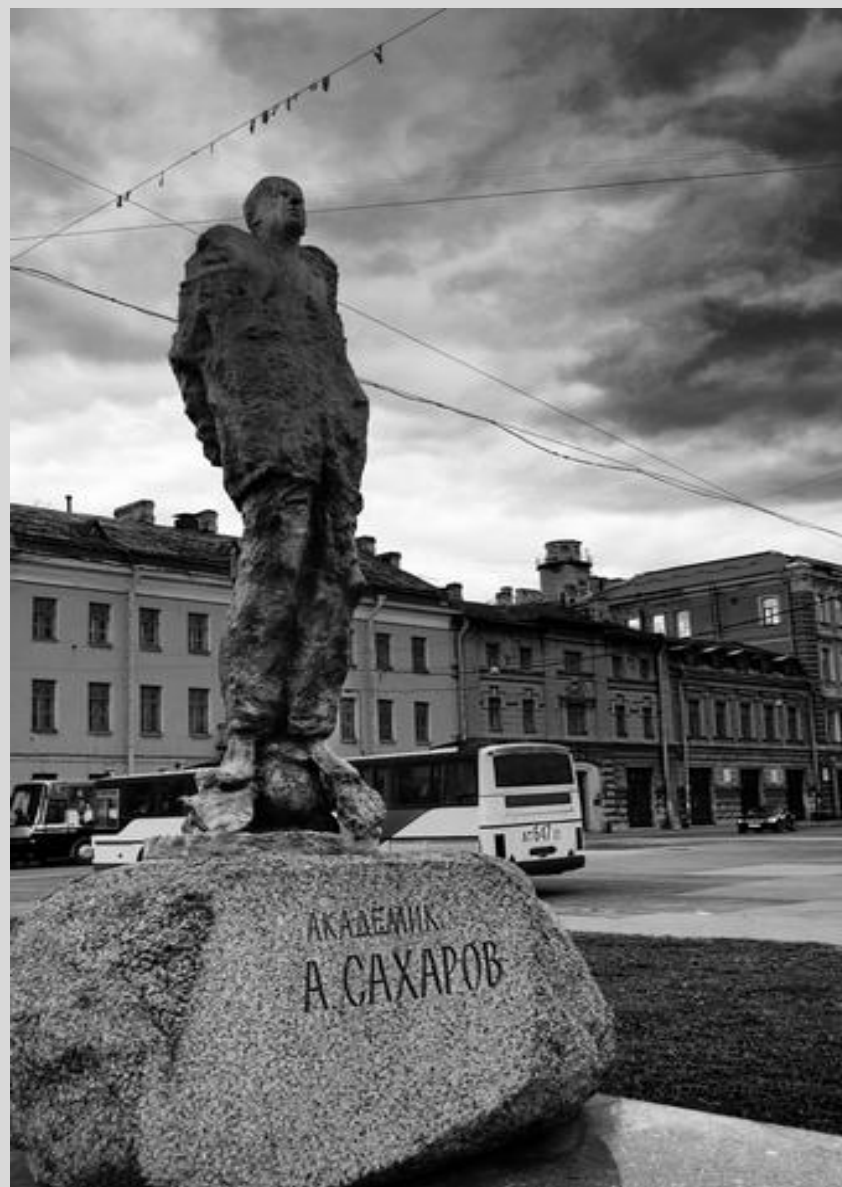
Памятник А.Д Сахарову в Петербурге