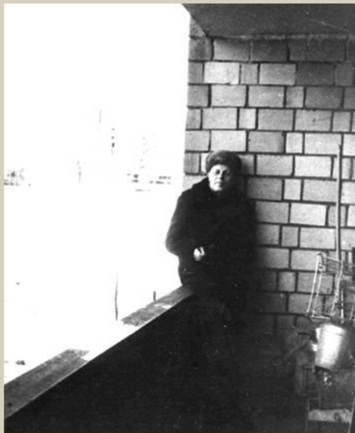
«Прогулка» на балконе в дни голодовки. 22 ноября - 4 декабря 1981