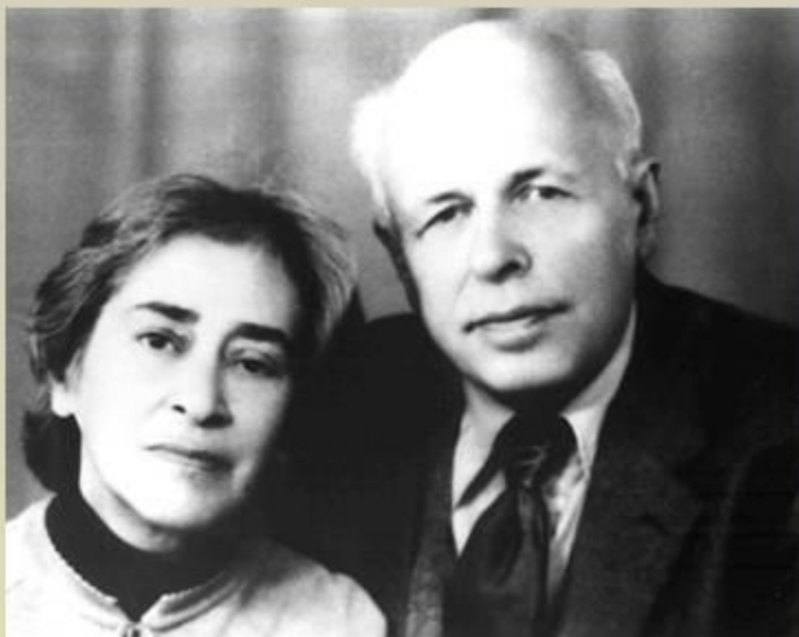
А.Д.Сахаров с женой Е.Боннер, сентябрь 1984

Контакты Андрея Дмитриевича с внешним миром осуществлялись главным образом через жену Елену Георгиевну Боннэр, которая бесстрашно использовала для этого поездки из Горького, вывозя тайно статьи, письма, обращения Андрея Дмитриевича. С мая 1984 г. эта возможность была пресечена.