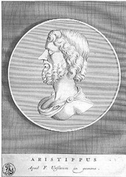
Аристипп – древнегреческий философ