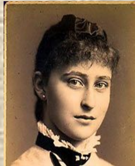
Великая княгиня Елизавета Федоровна Романова (1864-1918)