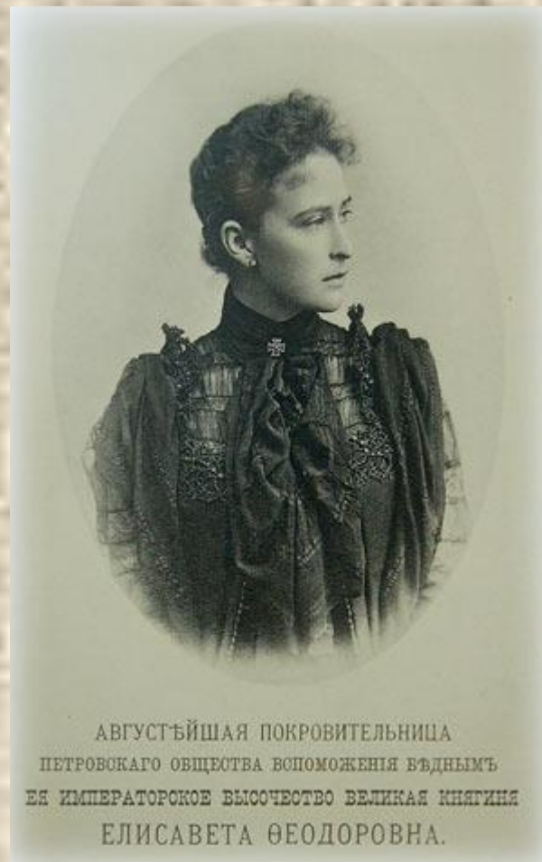
АВГУСТЪЙШАЯ ПОКРОВИТЕЛЬНИЦА ПЕТРОВСКАГО ОБЩЕСТВА ВОСПОМОЖЕНІЯ ВЪДНѢМЪ ЕЯ ИМПЕРАТОРСКОЕ ВЫСОЧЕСТВО ВЕЛИКАЯ КНЯГИНЯ ЕЛИСАВЕТА ФЕОДОРОВНА.