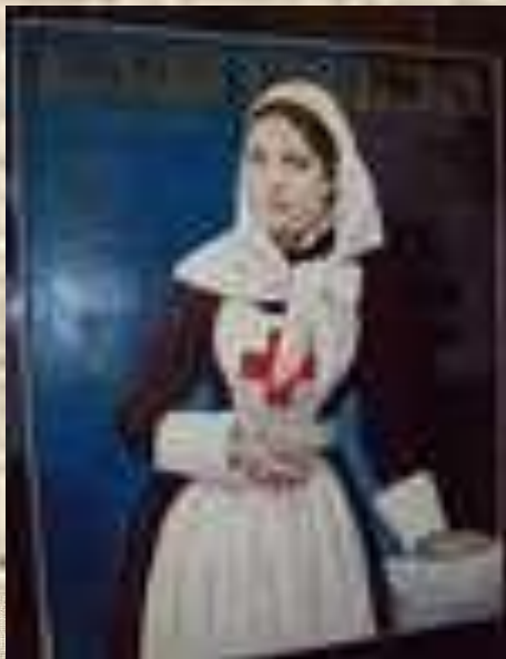
Баронесса Юлия Петровна Вревская (1841-1878)