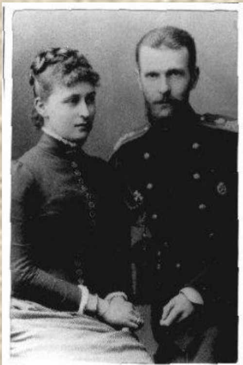
Великая княгиня Елизавета Федоровна и великий князь Сергей Александрович.