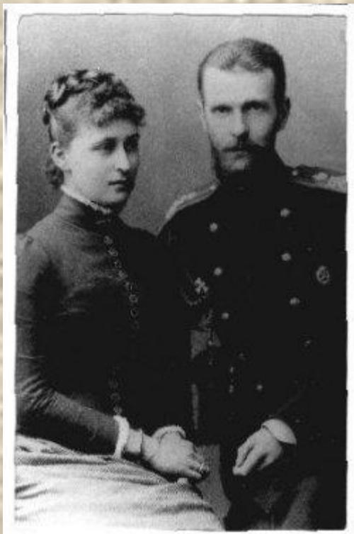
Великая княгиня Елизавета Федоровна и великий князь Сергей Александрович.