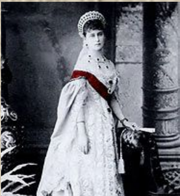
Великая княгиня Елизавета Фёдоровна

« Я испытывала такую глубокою жалостью к России и её детям , которые в настоящее время не знают , что творят. Разве это не больной ребёнок , которого мы любим во сто раз больше во время его болезни , чем когда он весел и здоров? Хотелось бы понести его страдания , помочь ему . Святая Россия не может погибнуть . Но великой России , увы, больше нет . Мы ... должны устремить свои мысли к Небесному Царствию ... и сказать с покорностью : «Да будет воля Твоя». (Из письма Елизаветы Федоровны)