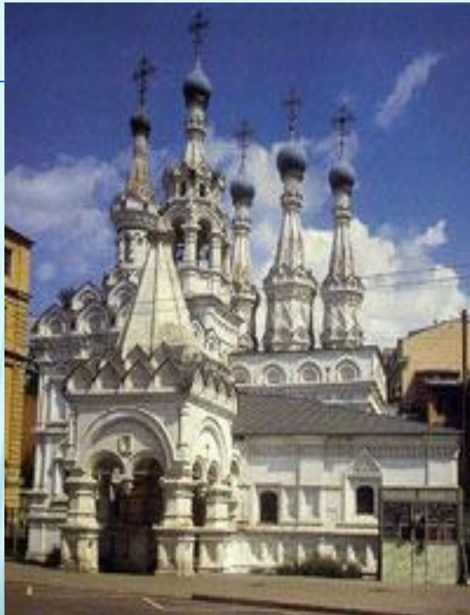
Церковь Рождества Богородицы в Путинках

Шатровое зодчество XVI–XVII вв., черпающее свое начало в традиционной русской деревянной архитектуре, является уникальным направлением русского зодчества, которому нет аналогов в искусстве других стран и народов. Шатровые храмы Московского государства – неповторимый вклад России в мировую культуру.