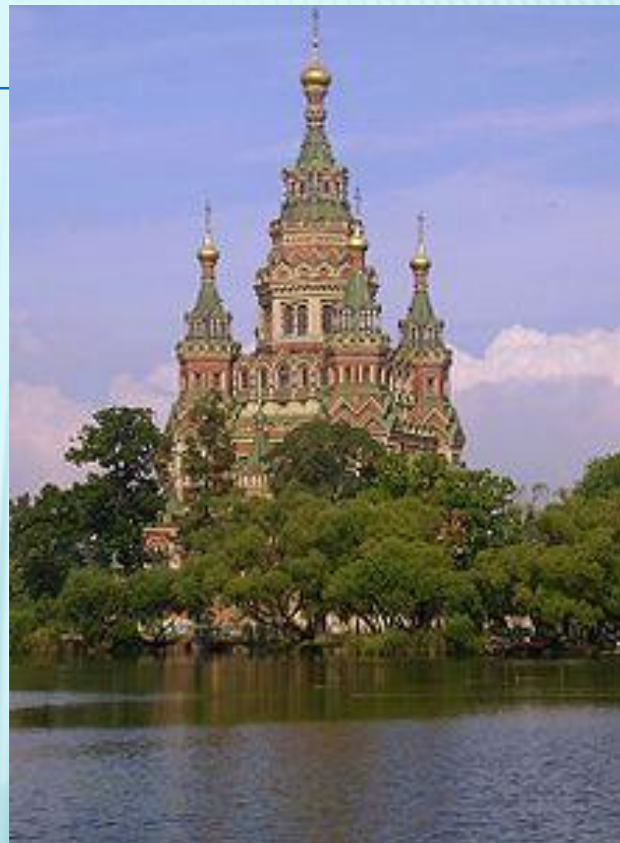
Собор Петра и Павла в Петергофе

происхождение шатрового каменного зодчества от аналогичного по форме шатрового деревянного , столь распространённого на Руси с древности до настоящего времени. «Летописец вкратце Русской земли» под 1532 годом говорит: «Князь великий Василей постави церковь камену Вознесение Господа нашего Иисуса Христа вверх на деревяное дело». Это летописное сообщение прямо связывает происхождение шатра с деревянным зодчеством. Выше приводились доказательства раннего происхождения деревянных шатровых храмов и их распространённости. Но если в деревянных церквях шатёр вынужденно сменил купол по конструктивным причинам, то замена купола шатром в каменном строительстве не связана с проблемой конструкции. Причину возникновения каменных шатров следует видеть в желании придать храму определённый образ. С. В. Заграевский отмечает, что и в Москве, и тем более в провинции вытянутые силуэты деревянных шатровых церквей играли ведущую роль.