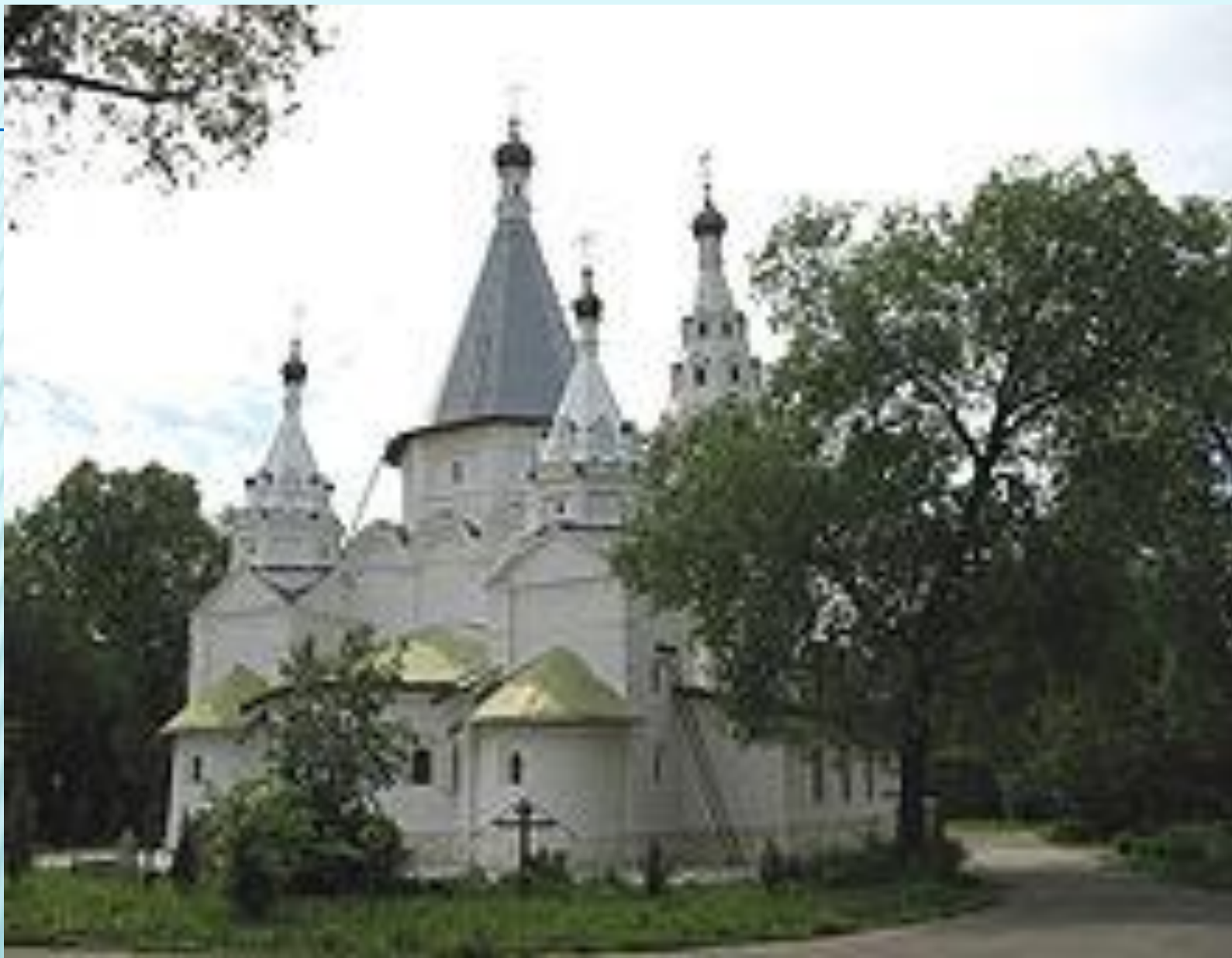
Церковь в Троицком-Голенищеве