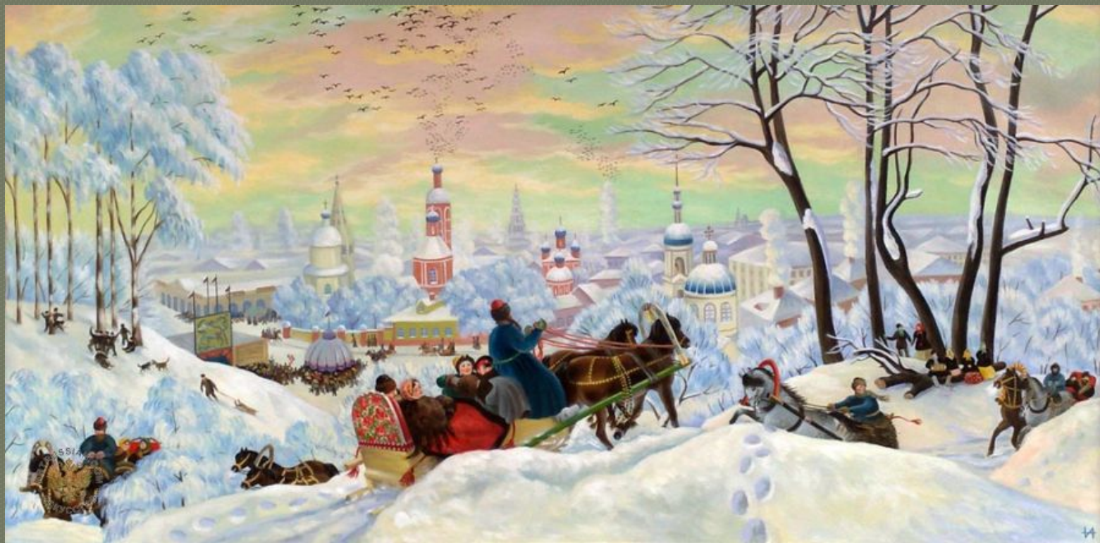
Б. М. Кустодиев «Блинный вторник»