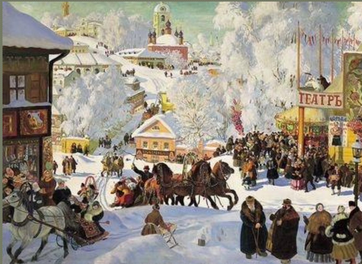
Б. М. Кустодиев “Масленица”