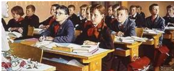
Школа в СССР