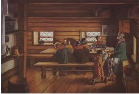
Школа в Древней Руси.