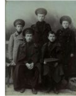
Гимназисты нач. 20 в.