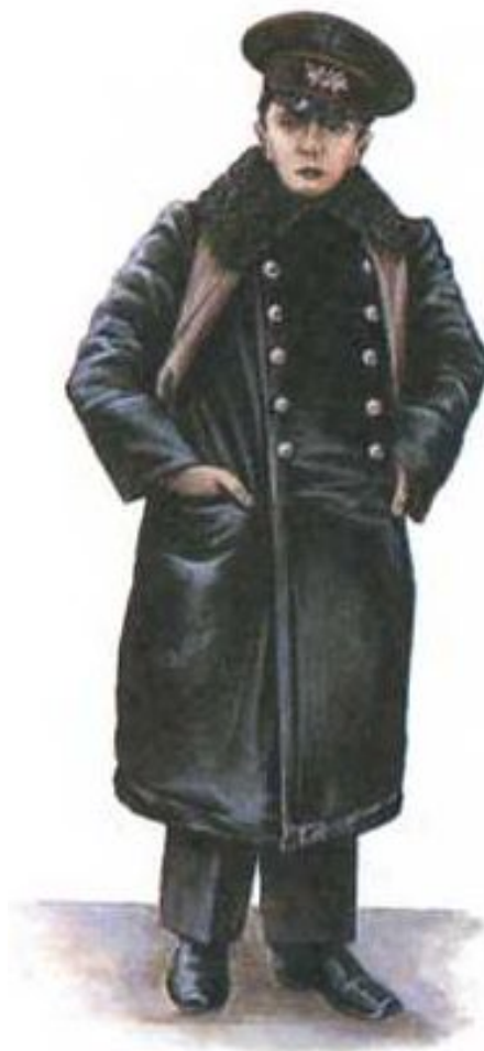
Ученик реального училища. Конец XIX в.