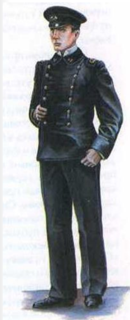
Студент Горного института. 1882 г.