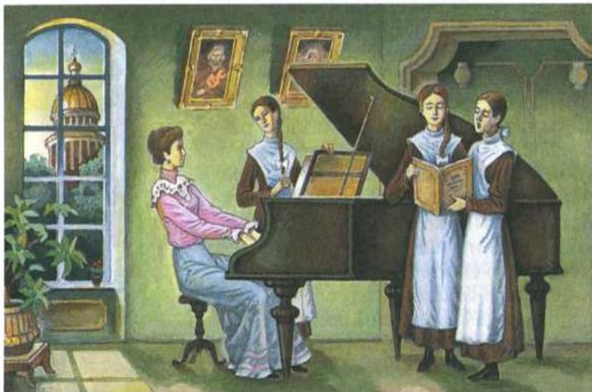
Гимназистки. Вторая половина XIX в.