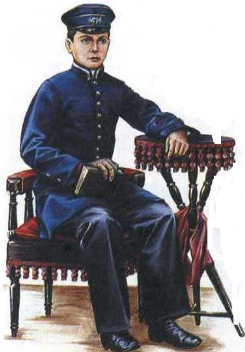
Гимназист. Конец XIX в.