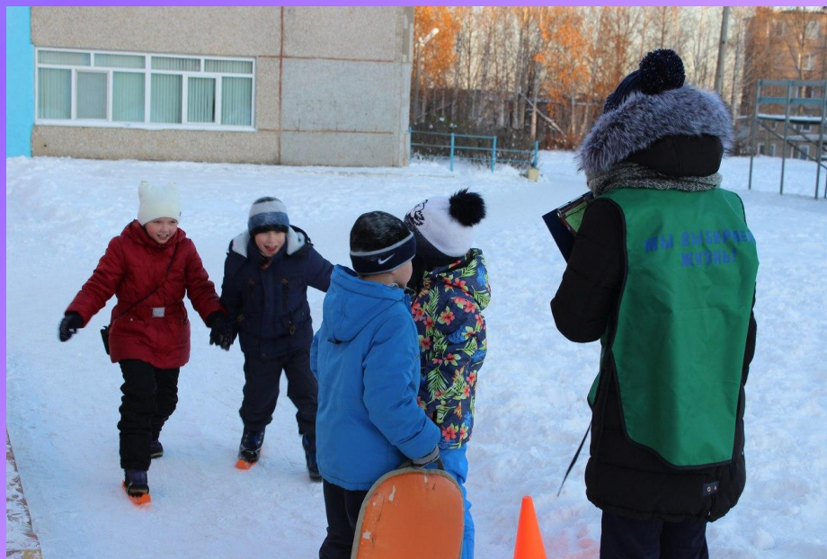
Реализация проекта «Наш девиз по жизни-ЗОЖ!»