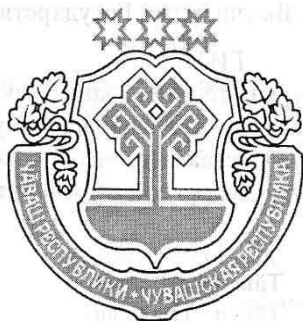
Государственный герб Чувашской Республики

2. Запиши, что означают цвета и изображения на флаге и гербе.