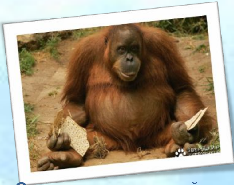
Орангутанг – «лесной человек»