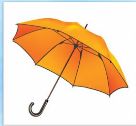
Зонтик – zondek – «покрышка от солнца»