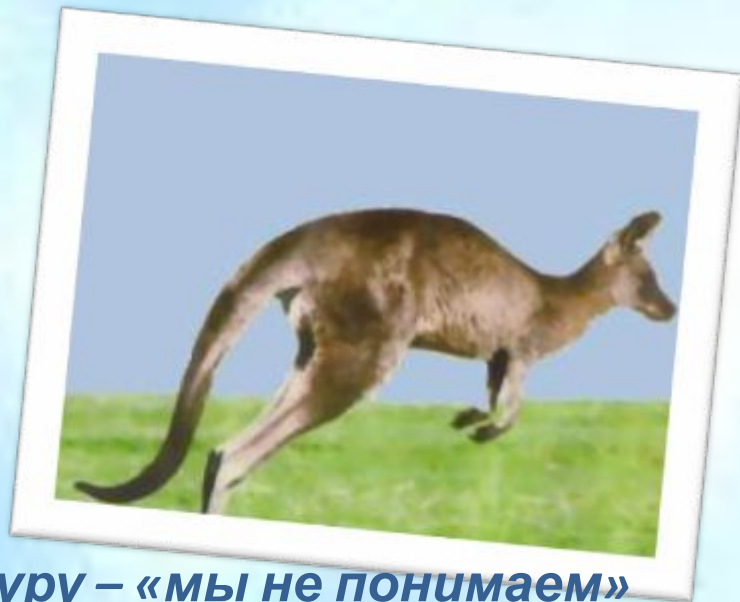
Кенгуру – «мы не понимаем»