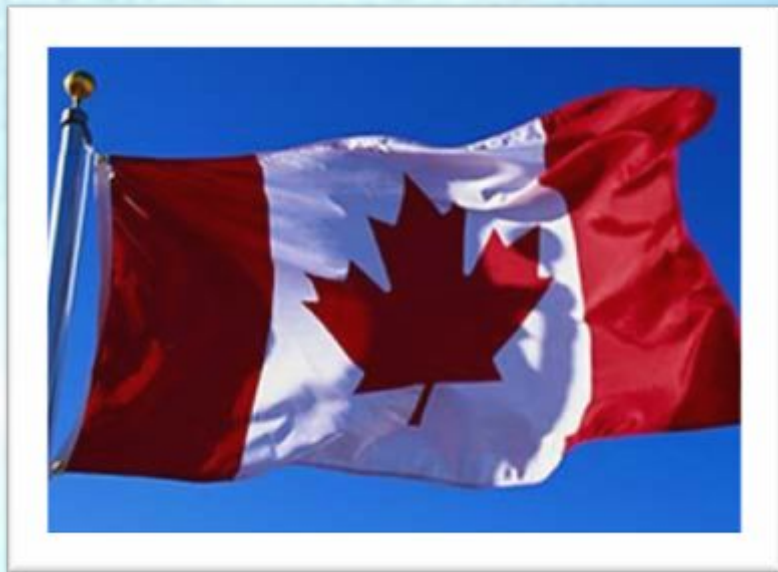
Канада – «хижины»