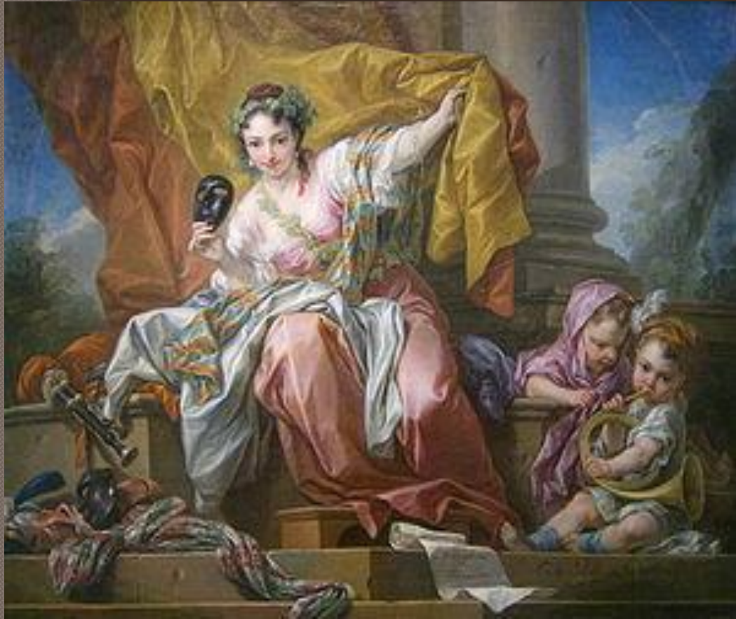
Аллегория комедии Ванло, 1752.