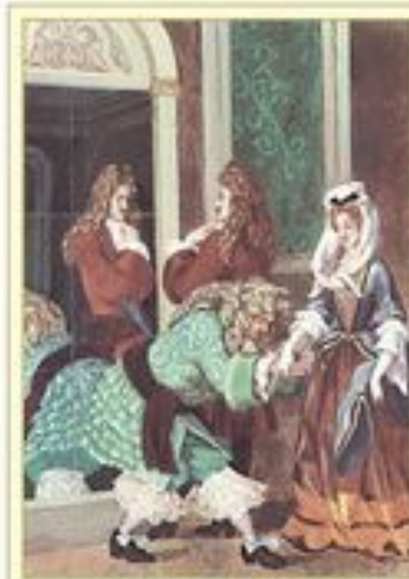
Иллюстрация к комедии Ж. Б. Мольера «Мизантроп» из дворцовой Художник А. Архипов