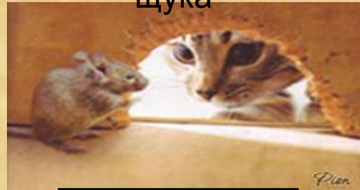
Кошка и мышь