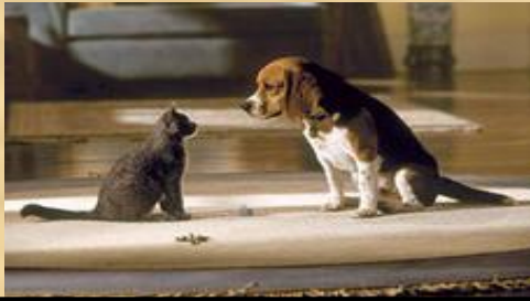
Дружба кошки с собакой