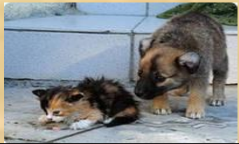
Как кошка обманула собаку