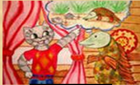
Кот и щука