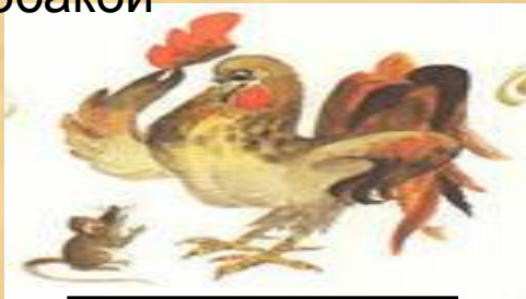
Мышь и петух