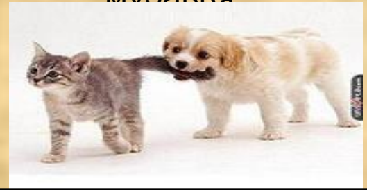
Как кошка поссорилась с собакой