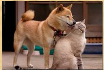
Кошка и собака