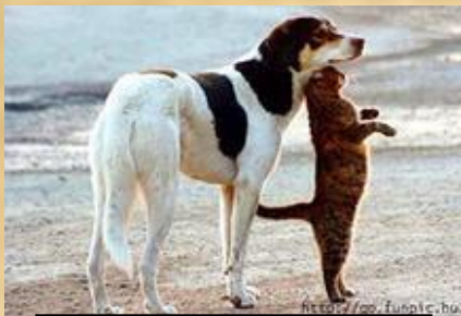
Кошка и собака