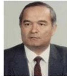
Президент Республики Узбекистан