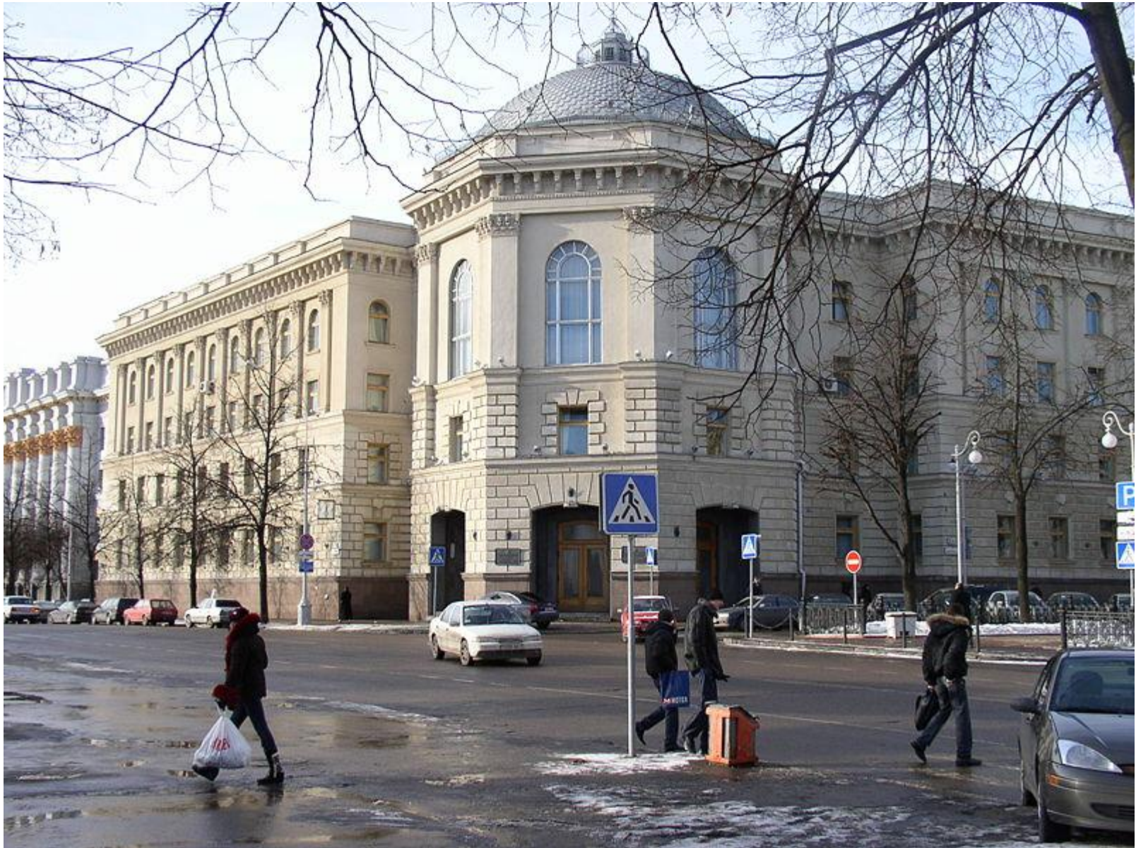
Здание Исполкома СНГ в Минске