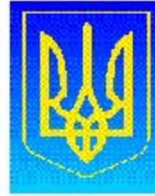
Герб Украины Президент Украины