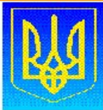
Герб Украины Президент Украины