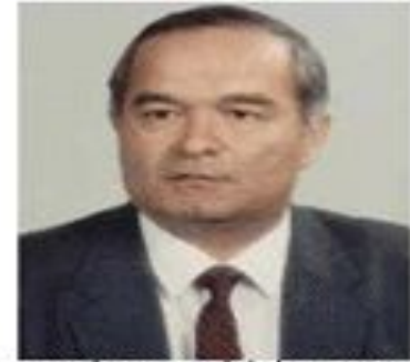
Президент Республики Узбекистан