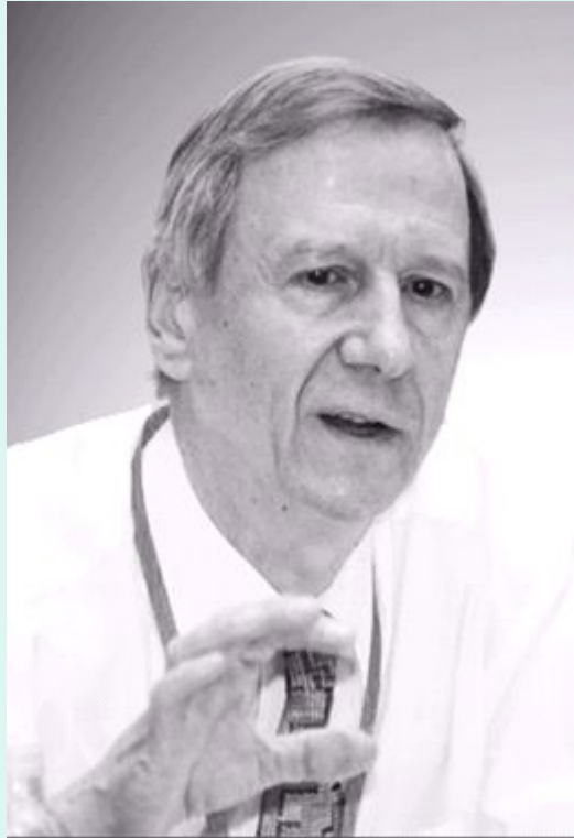
Энтони Гидденс род. 1938

У Энтони Гидденса есть любопытная зарисовка о народах племени Накирема: «Народ Накирема верит, что, если не исполнять определенный ритуал, зубы выпадут, десны начнут кровоточить, челюсти станут шамкать, а самого человека покинут друзья и отвергнут любовники. Накирема испытывают почти патологический ужас и благоговение перед своим ртом, состояние которого, по их мнению, сверхъестественным образом воздействует на все общественные отношения. Ежедневный ритуал, неукоснительно соблюдаемый каждым Накирема, включает и специфические манипуляции с ротовой полостью. Накирема берут в рот пучок свиной щетины, покрытый магическим порошком, и выполняют там серию каких-то чрезвычайно формализованных движений» .