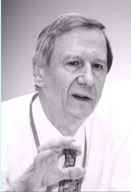
Энтони Гидденс род. 1938

Гидденс Э. Социология. М., 2004. С. 50–51.