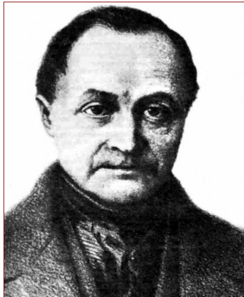
Огюст Конт (1798—1851)