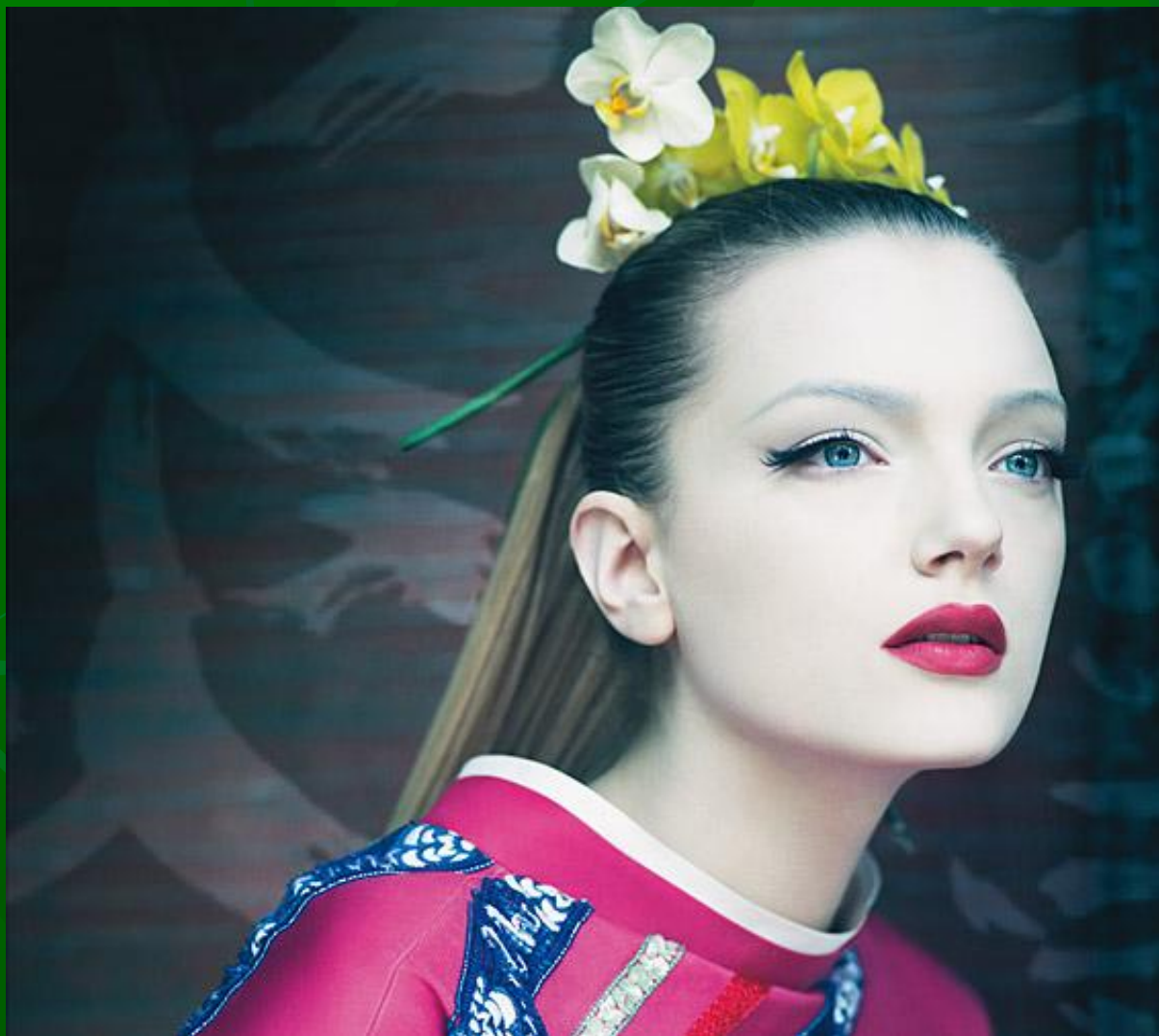
Lily Donaldson -Pirelli Calendar -May 2008