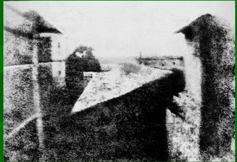
Первая фотография в мире, «Вид из окна», 1826

Сам термин «фотография» появился в 1839 году, его использовали одновременно и независимо два астронома — английский, Джон Гершель, и немецкий, Иоганн фон Медлер.