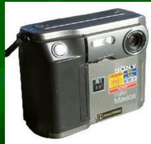
Sony Mavica (1981 год)

В настоящее время цифровая фотография повсеместно вытесняет плёночную в большинстве отраслей.