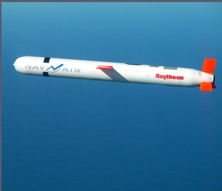
Крылатая ракета «Томагавк» США в полёте

Крылатая ракета — как правило, беспилотный летательный аппарат однократного запуска, оснащённый крыльями, системой наведения и воздушно-реактивным двигателем . При этом существовали конструкции, и имеющие ракетные двигатели , и управляемые пилотами-смертниками. Устаревшие названия — самолёт-снаряд, планирующая бомба.