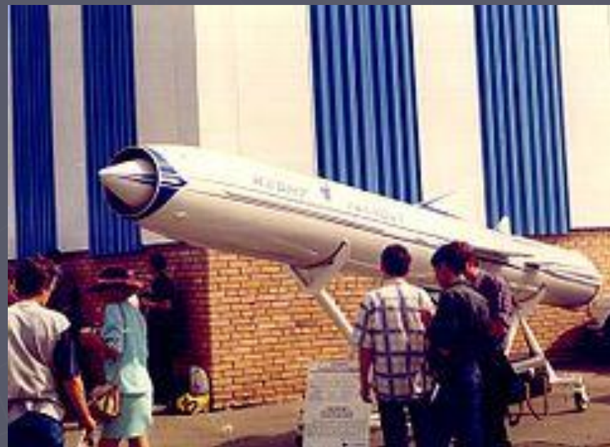
ПКР П-800 «Оникс», Россия