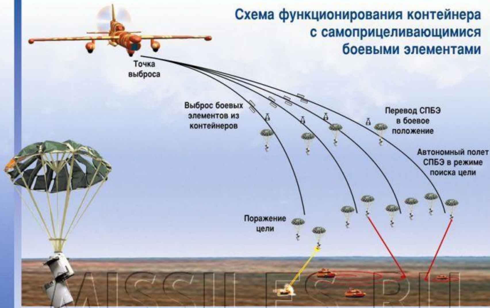
Схема функционирования контейнера с самоприцеливающимися боевыми элементами