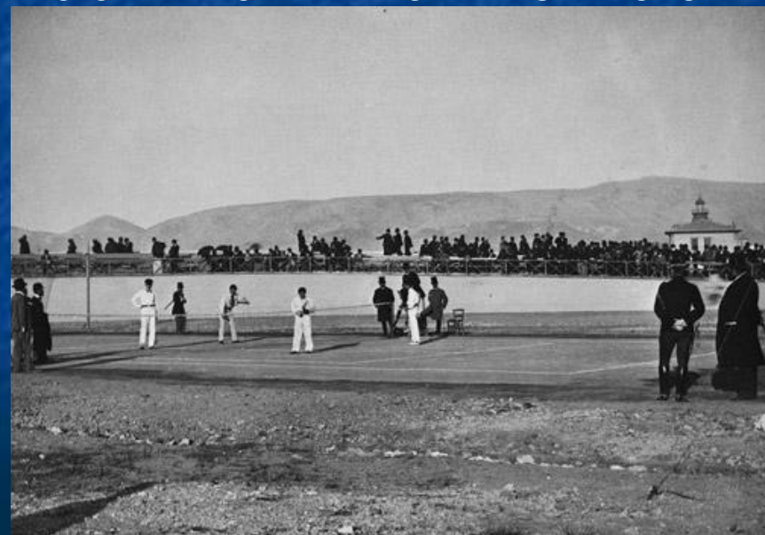
На соревнованиях по теннису