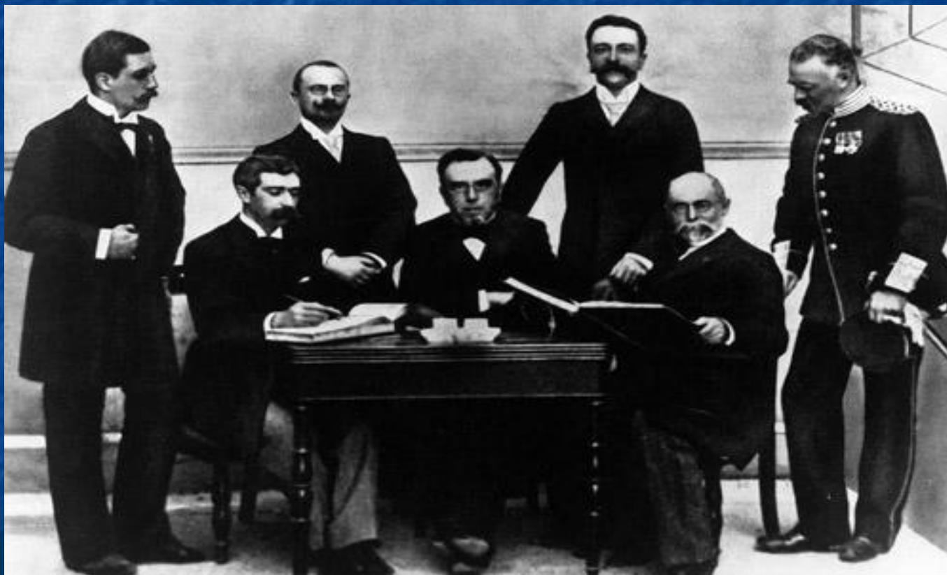
Члены Международного олимпийского комитета

На конгрессе, проведённом 16-23 июня 1894 года в парижском университете Сорбонне, он представил свои мысли и идеи международной публике. В последний день конгресса было принято решение о том, что первые Олимпийские Игры современности должны состояться в 1896 году.