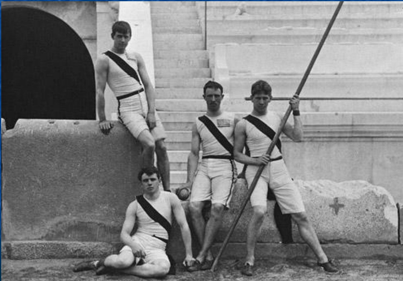
Американские спортсмены из Принстонского университета