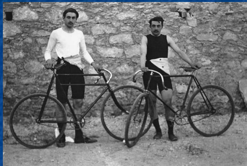
Французские велогонщики Леон Фламан и Поль Массон. Фламан завоевал золото гонке на 100 км, а Массон выиграл золотые медали на дистанциях 2 км и 10 км