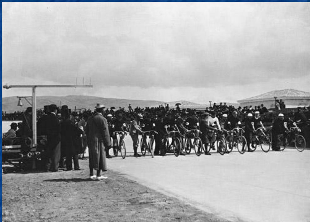
На старте соревнований по велоспорту

Изначально Кубертен хотел сделать Олимпийские игры любительским соревнованием, в котором нет места профессионалам, занимающимся спортом за деньги