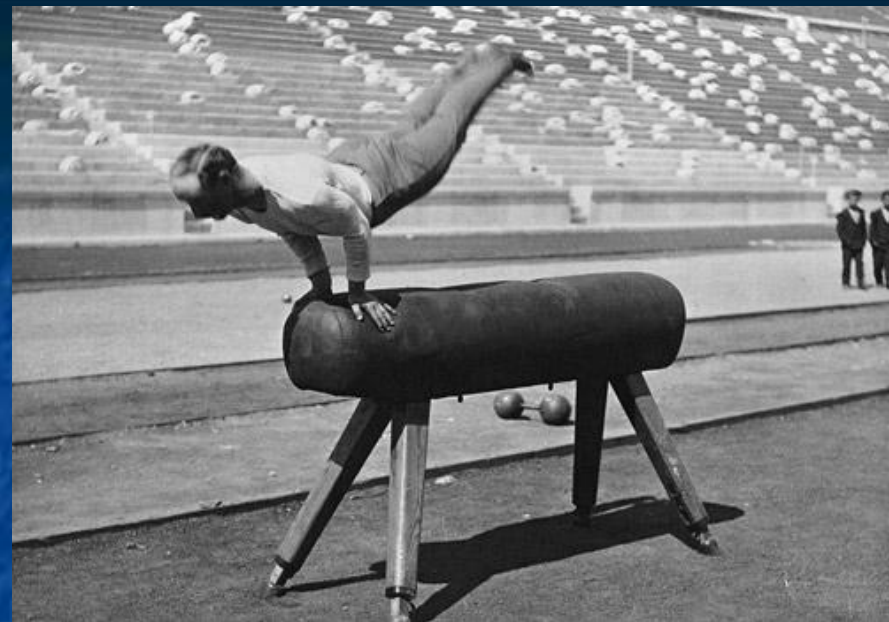
Немецкий гимнаст Карл Шуман, ставший олимпийским чемпионом