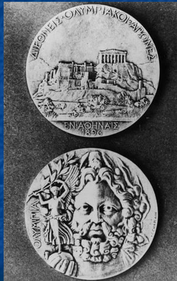
Олимпийские медали образца 1896 года