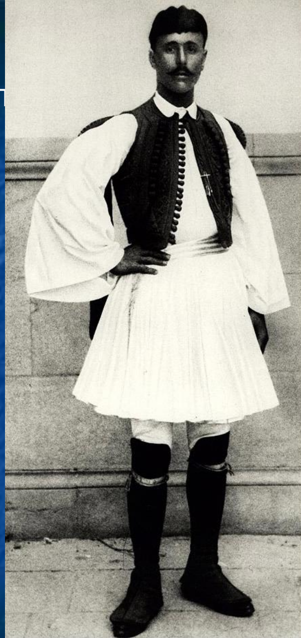
Греческий спортсмен Спиридон Спиридон Луис – победитель первого олимпийского марафона