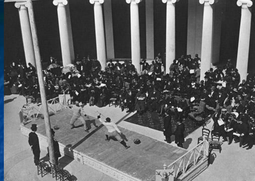
Соревнование по фехтованию