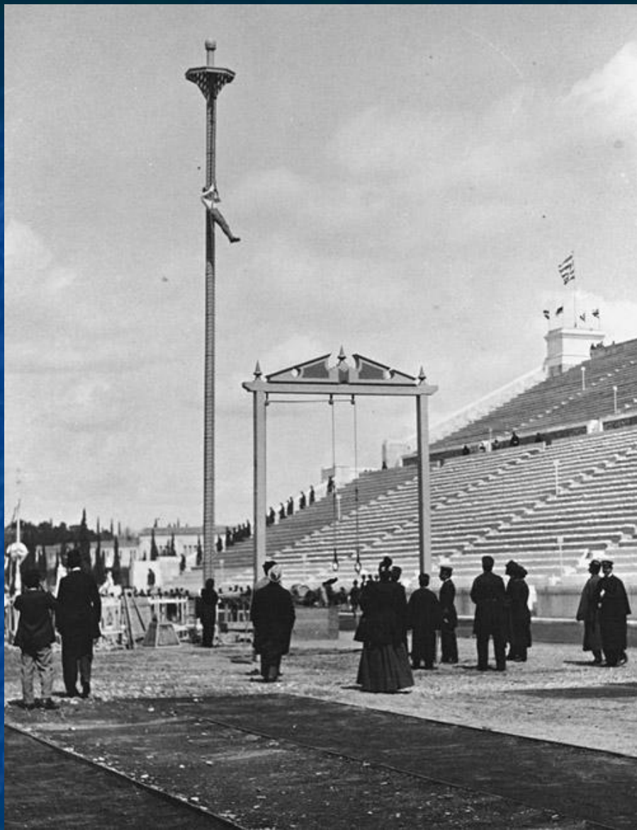
Один из видов гимнастических соревнований - канат