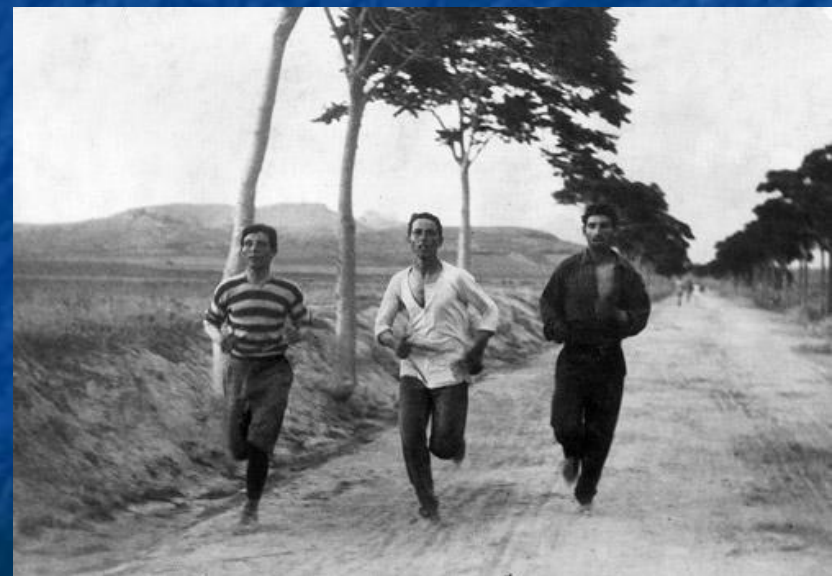
Тренировка легкоатлетов перед марафоном