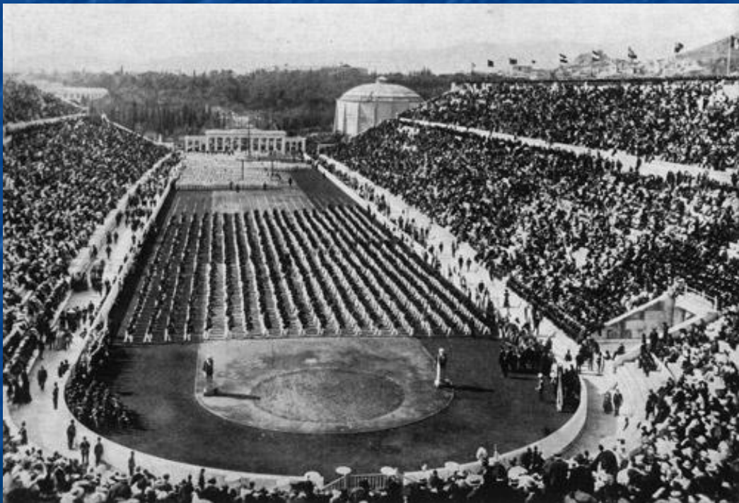
Церемония открытия игр в Афинах, 1896 год

Первые Игры современности прошли с большим успехом. Несмотря на то, что участие в Играх приняли всего 241 атлет из 14 стран, Игры стали крупнейшим спортивным событием, прошедшим когда-либо со времён Древней Греции.