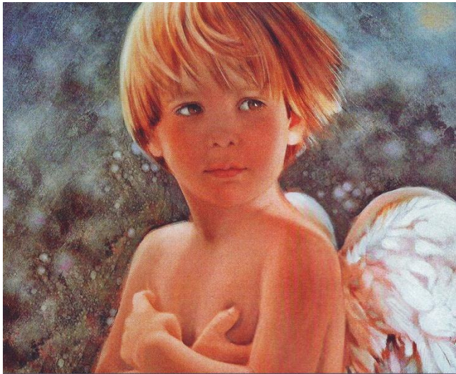
Ноэль Нэнси. Ангел. 2003