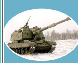
Ракетные войска и артиллерия