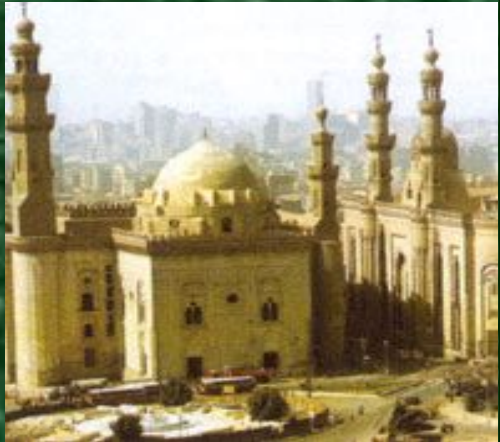
Мечеть (молитвенное здание)

Он родился в Мекке в 570 г. Мухаммед принадлежал к обедневшему роду хашим. Рано осиротев, он жил в семье своего деда, потом дяди. У него были трудные детство и юность: он пас овец, в 25 лет сопровождал караваны.