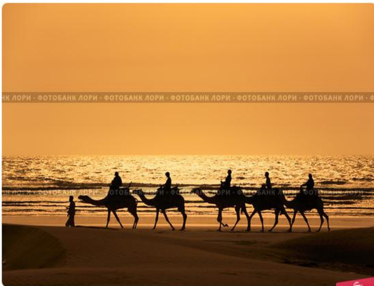
Силуэты людей на верблюдах идущих вдоль берега океана на закате солнца

Через купцов он познакомился с религиями, а женитьба на богатой вдове Хадидже позволила ему заниматься тем, к чему он был призван: осмысление религиозных проблем, проблем жизни общества.