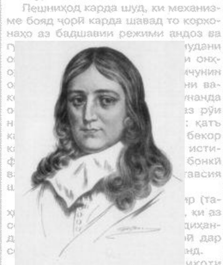
Джон Милтон (John Milton)

иштирок кардани элим буд, ки барои олият ба ҳисоби миёна 3 рухсатнома ва мувофиқатнома гирифтанд, боз як рухсатнома гирифтанд ва мувофиқатнома гирифтанд. Қариб сеяки респондентҳо бар онанд, ки чарабини гирифтани рухсатнома ва мувофиқатнома ҳанӯз ҳам мураккаб аст ва кори проблемавӣ мебошад. Базаи нормативии мавҷуда, танзимгари кори ба даст даровардани рухсатнома ва мувофиқатнома