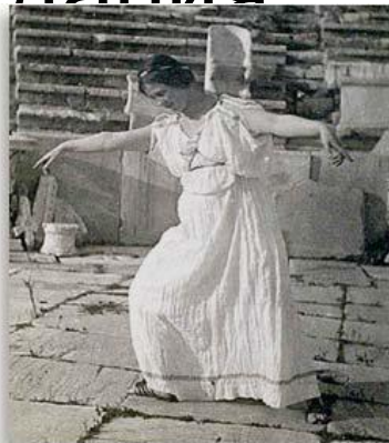
At the Theatre of Dionysus, Athens — 1903