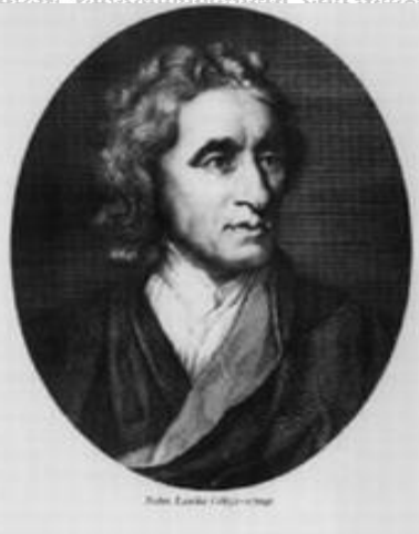
Джон Локк (John Locke)

Соли 2003 он тадбиркороне, ки тарзи илорашавандаи санҷишхоро ба ҳақ то леҷа-чун мураккаб аст ва кори проблемавӣ мебошад. Базаи нормативии мавҷуда, танзимгари кори ба даст даровардани рухсатнома ва мувофиқатнома