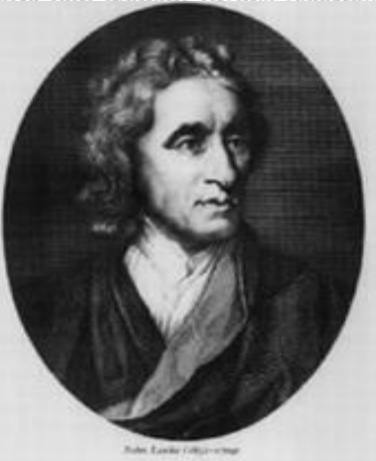
Джон Локк (John Locke)