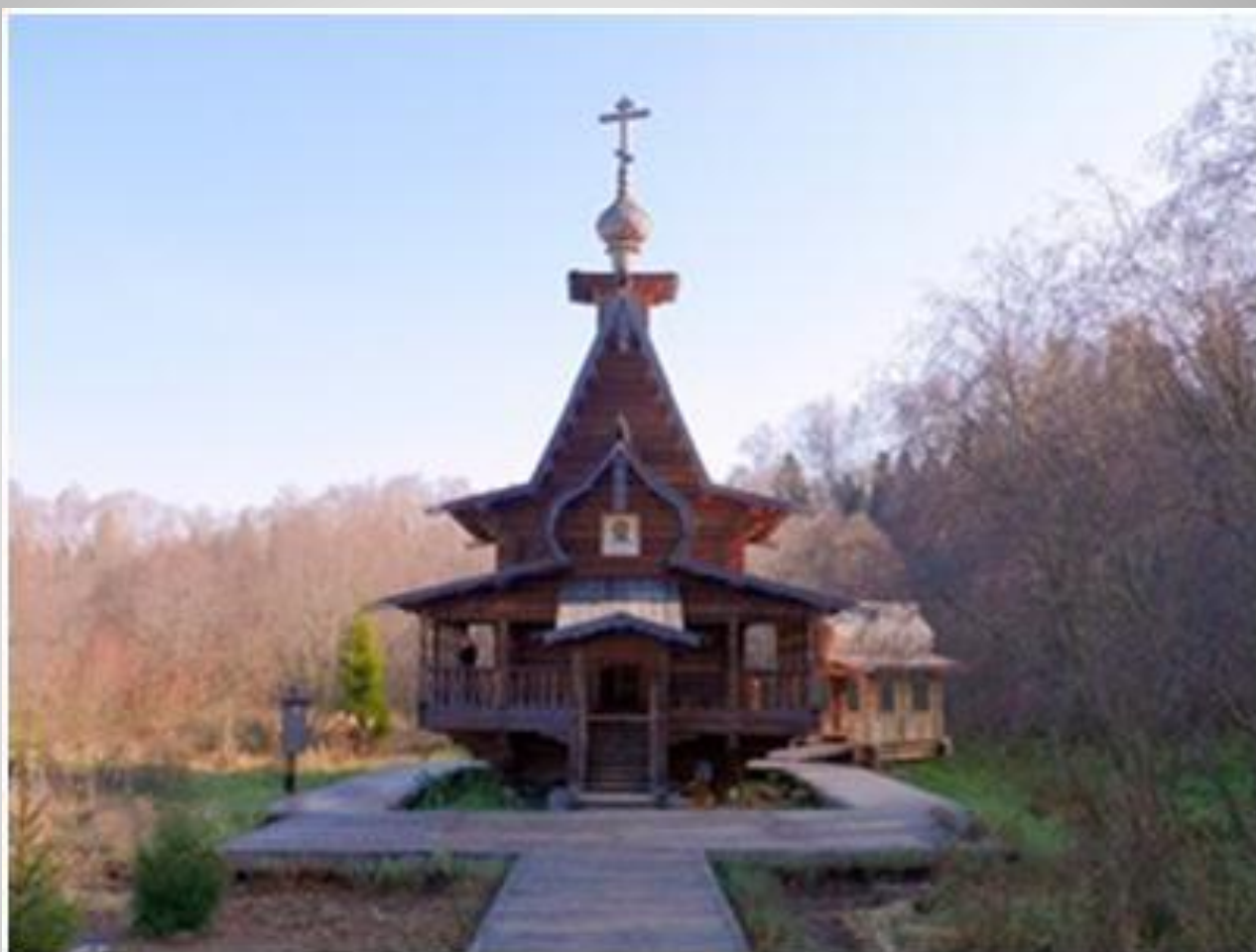
Часовня Сергия Радонежского у Взгляднево