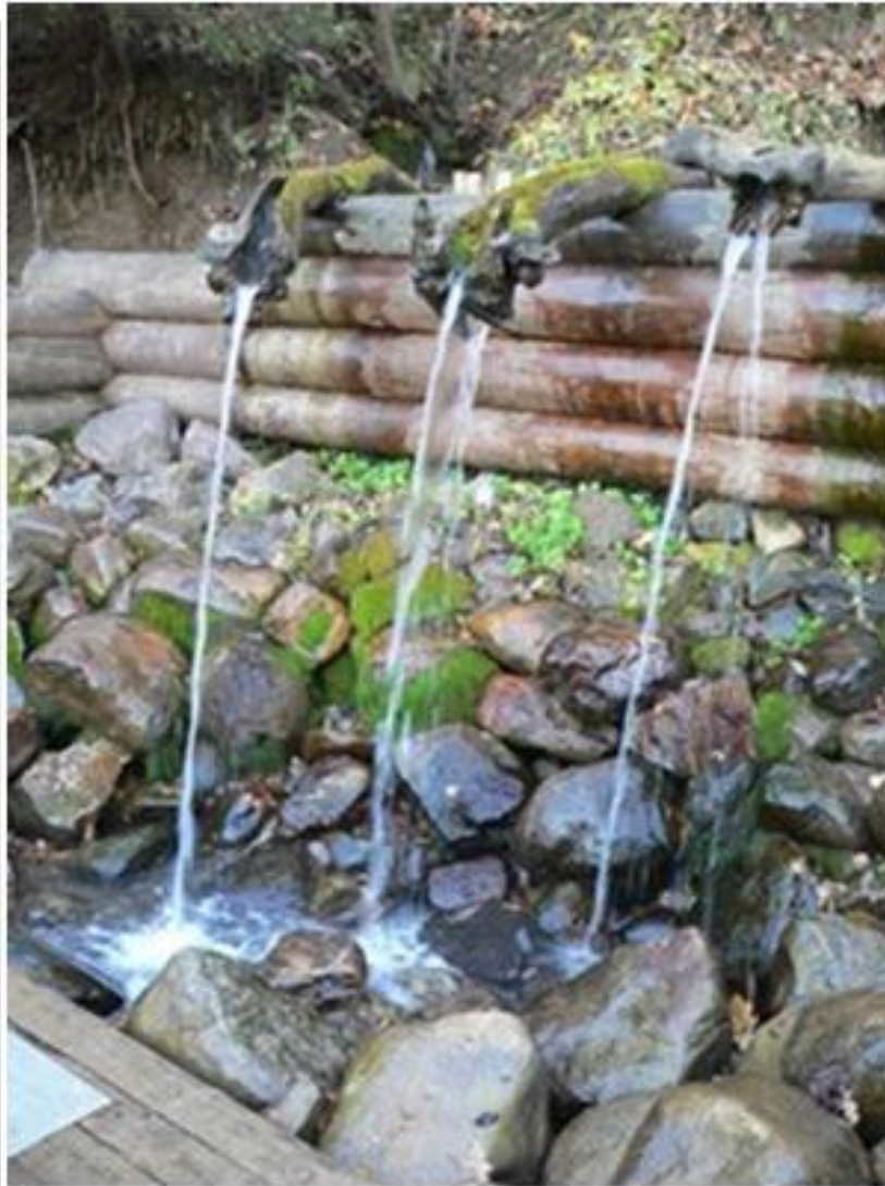
Святой источник преподобного Сергия Радонежского