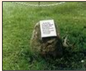
Мемориальный камень до 1999 г.