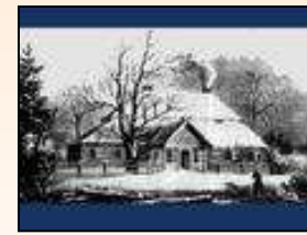
Картина М. Кулеши. 1845 г.