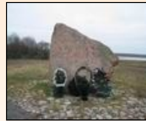
30 ноября 2003 г.