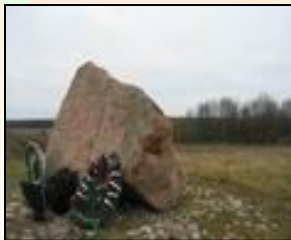
Мемориальный камень поставлен в 1999 году