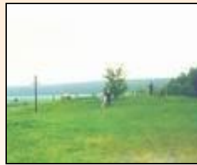
Так здесь было до 1999 г.