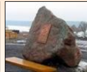
4 февраля 2004 года