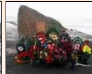
4 февраля 2004 года