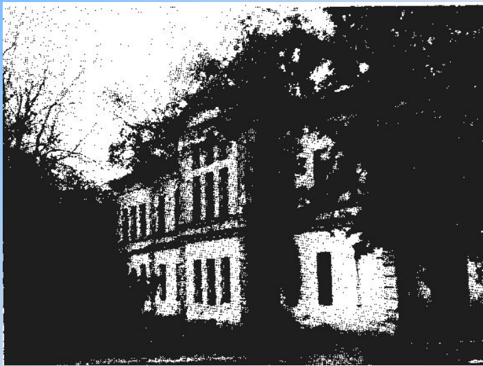
Здание бывшего монастырского приюта

В двухэтажном каменном корпусе приюта находились церковно-приходская школа и рукодельное отделение. Все дети села с 1894 года в церковно-приходской школе обучались счёту и письму.