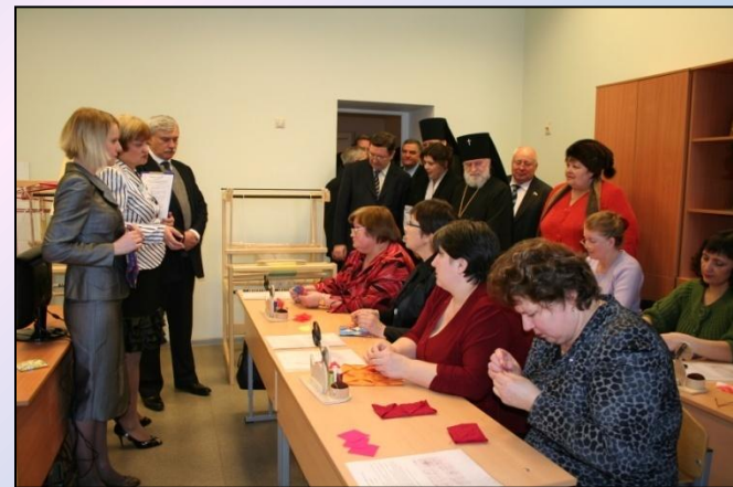
В настоящее время в здании располагаются мастерские отделения Православной педагогики Тамбовского педагогического колледжа