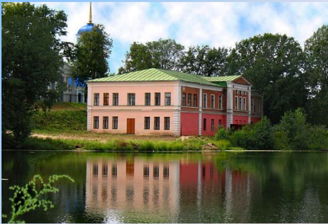
Бывшее здание школы (до 2009 года), в котором в 1879 году был открыт приют для девочек

2 декабря 1879 г. Указом Св. Синода в с. Тулиновка была учреждена женская община и одновременно при ней открыт приют для девочек. Все было переименовано в женский монастырь , которому передали приходскую Успенскую церковь.