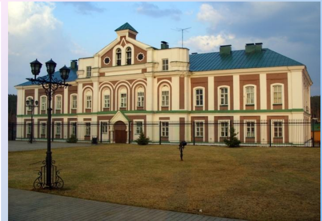
Здание бывшего женского монастыря