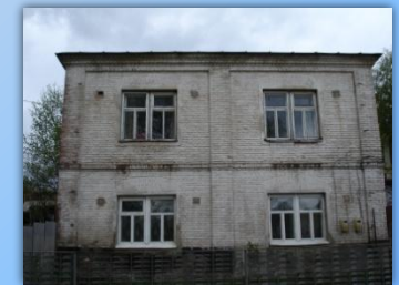
Здание в настоящее время