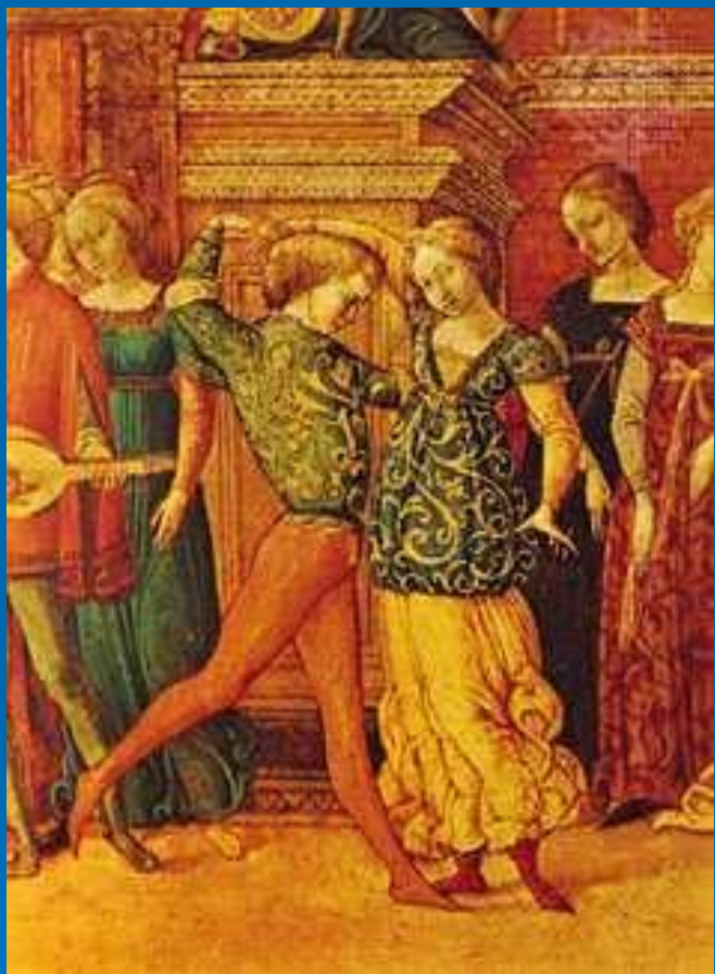
Танец Гальярда в Сиене, Италия, XV век

Гальярда — старинный танец итальянского происхождения, распространённый в Европе в конце XV—XVII вв.. По своему происхождению гальярда — это народный танец, однако в конце XV века её стали танцевать и при дворе.