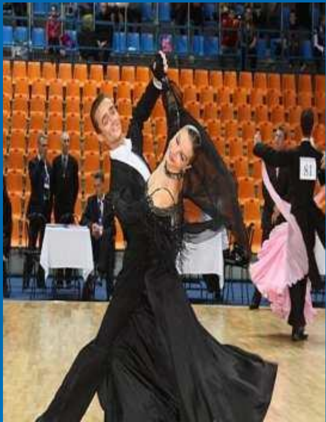
Спортивные балльные танцы, дискофокс, хастл, babydance в Химках

Хастл — парный танец, основанный на импровизации и «ведении». Является собирательным названием для танцев под музыку в стиле диско популярной в 1980-х, таких как диско-Фокс, диско-свинг и собственно хастл.