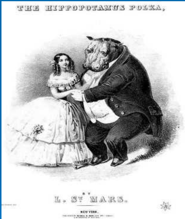
Обложка нот «Польки гиппопотама», изданной в Нью-Йорке в начале 1850-х

Полька — быстрый, живой среднеевропейский танец, а также жанр танцевальной музыки. Появился в середине XIX века в Богемии, и с тех пор стал известным народным танцем.