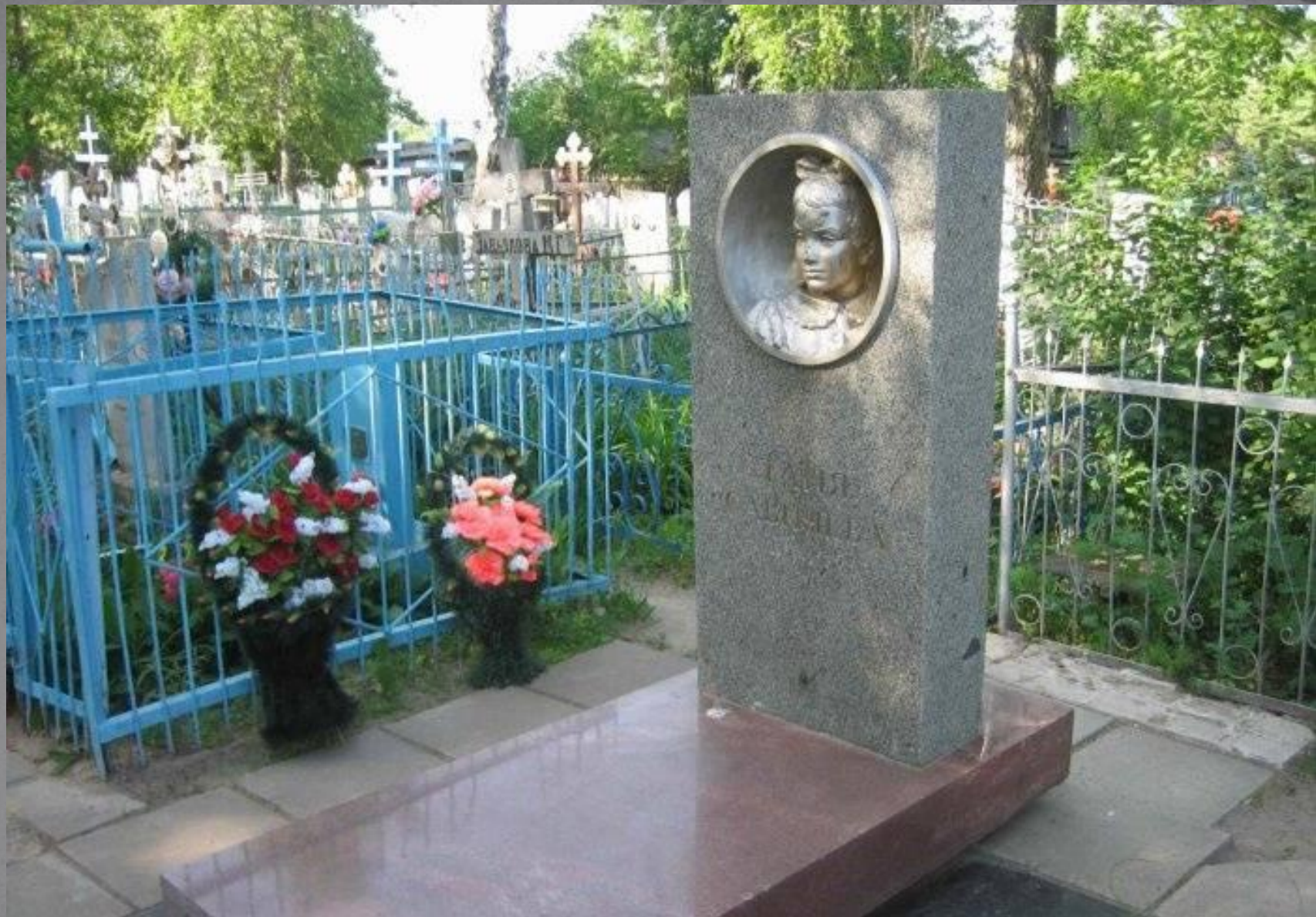
Шатки, Могила Тани Савичевой.