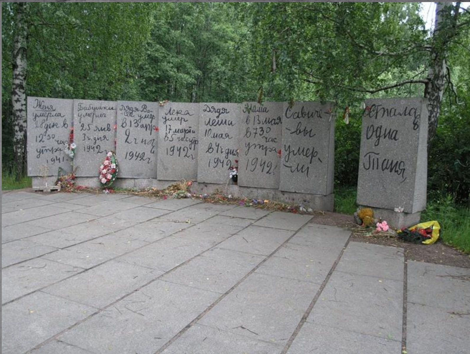
Дневник Тани Савичевой, в память о блокаде Ленинграда.