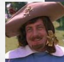
Рис 1. Виды темперамента