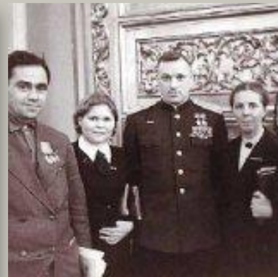
Делегаты Верховного Совета