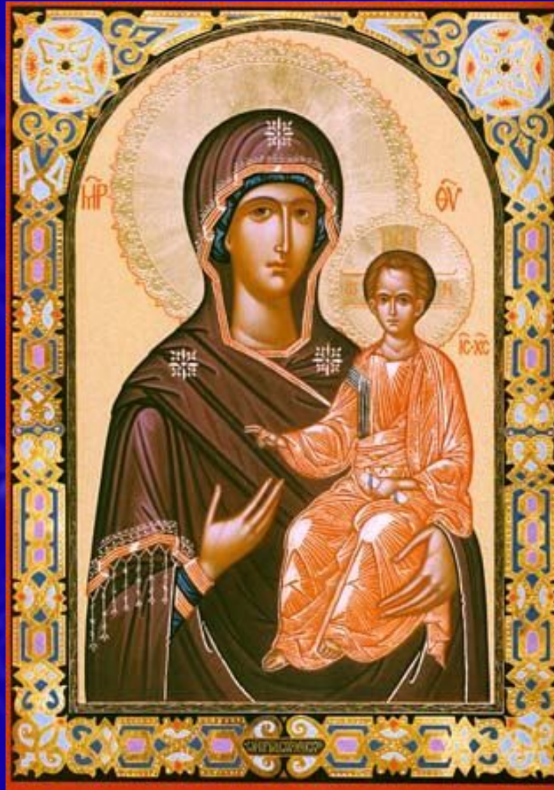
Икона Божьей Матери