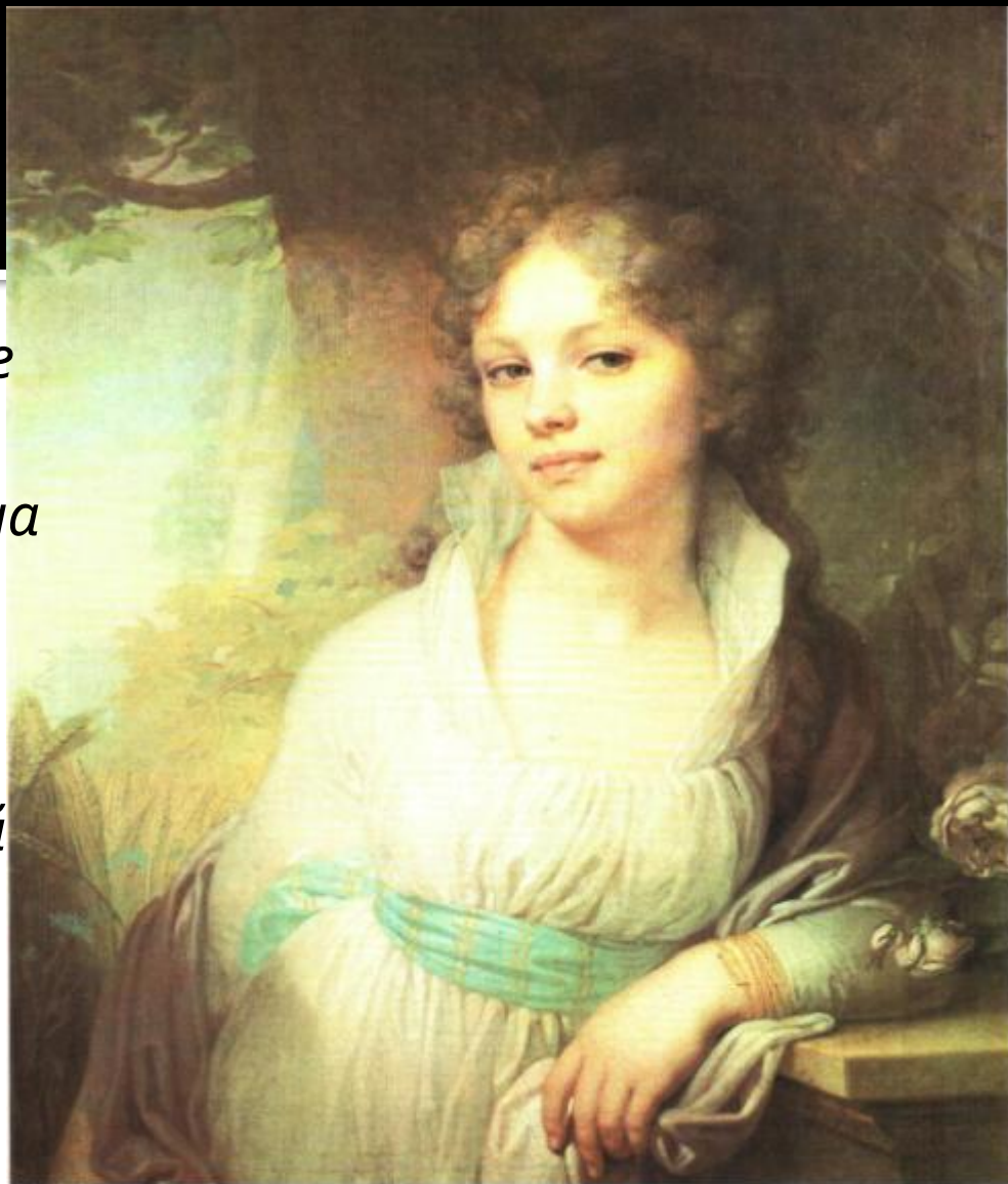
В.Боровиковский. ПОРТРЕТ ЛОПУХИНОЙ.