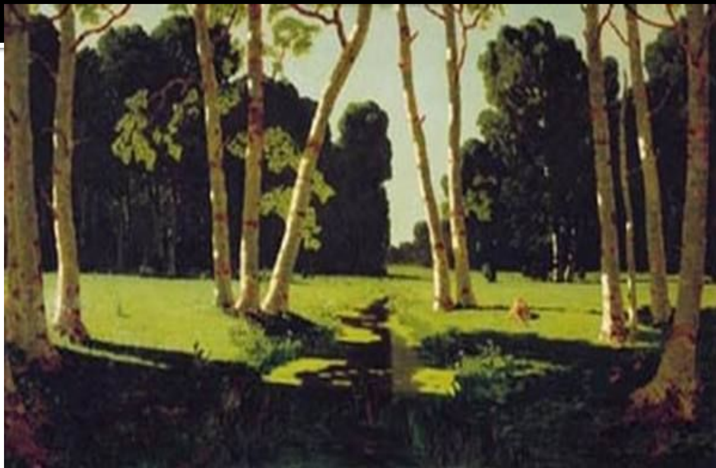
А.Куинджи. БЕРЁЗОВАЯ РОЩА.