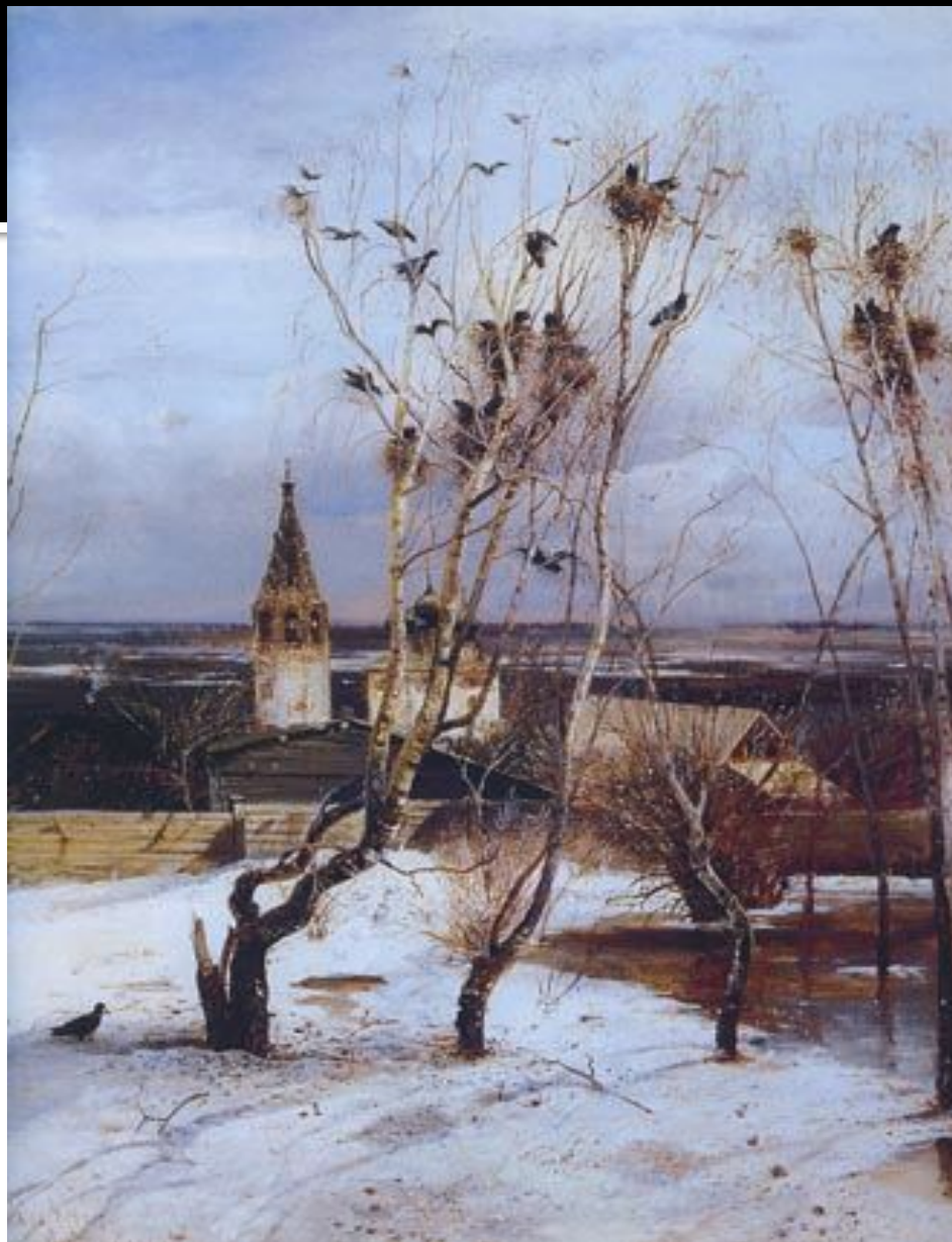
А.Саврасов. ГРАЧИ ПРИЛЕТЕЛИ.