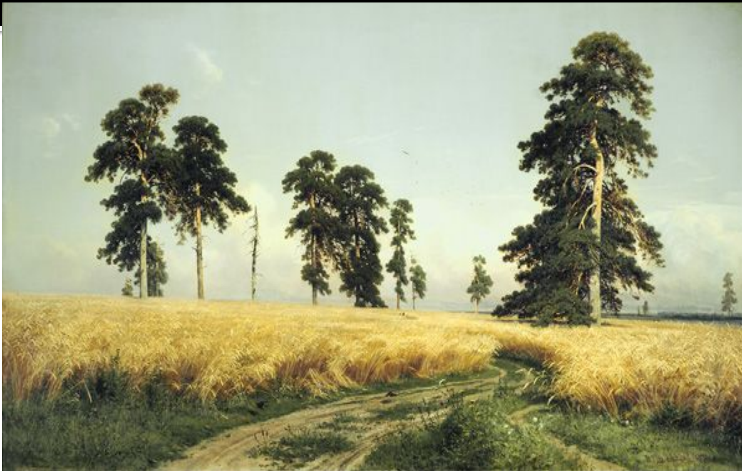
■ И.И.Шишкин. РОЖЬ.