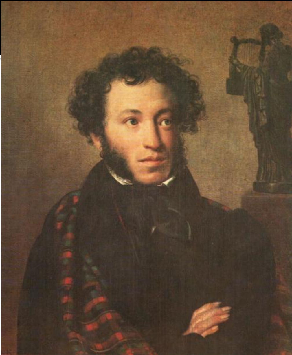
О.Кипренский. ПОРТРЕТ А.С.ПУШКИНА.