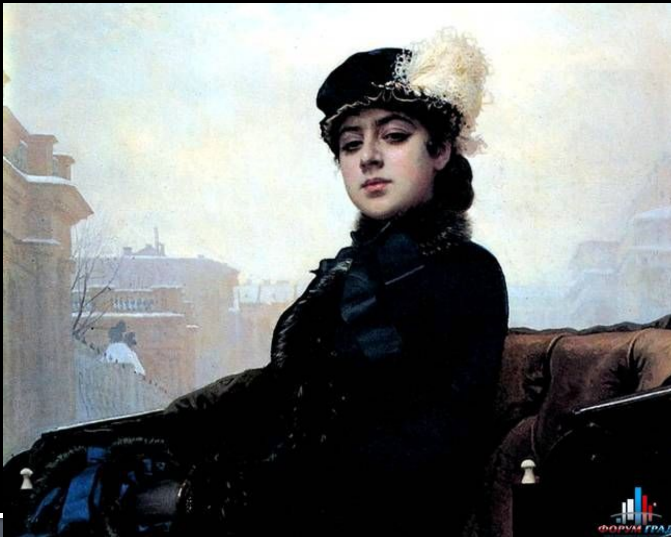
И.Н.Крамской. Портрет неизвестной