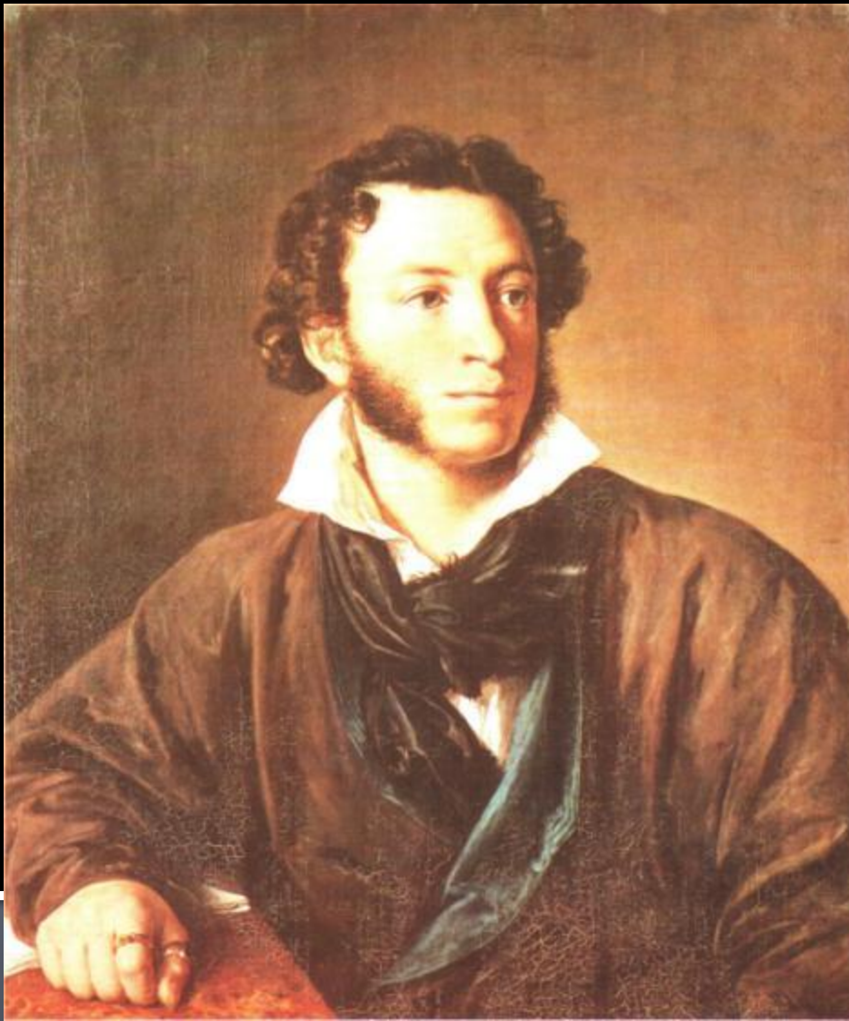
В.Тропинин.ПОРТРЕТ А. С.ПУШКИНА