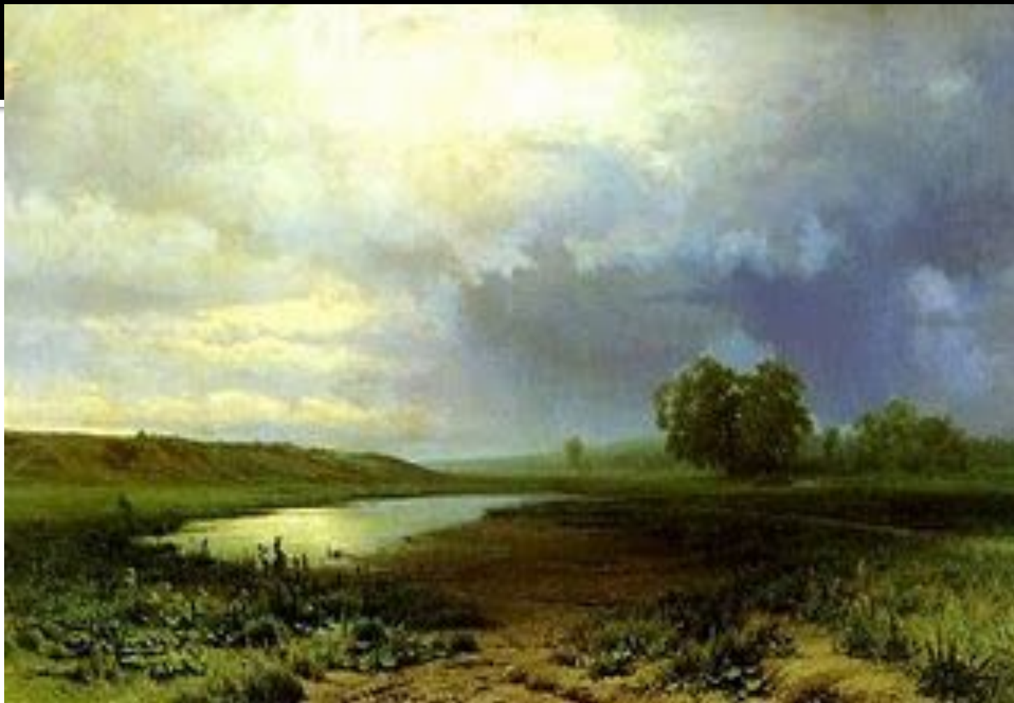
Ф.Васильев. МОКРЫЙ ЛУГ.