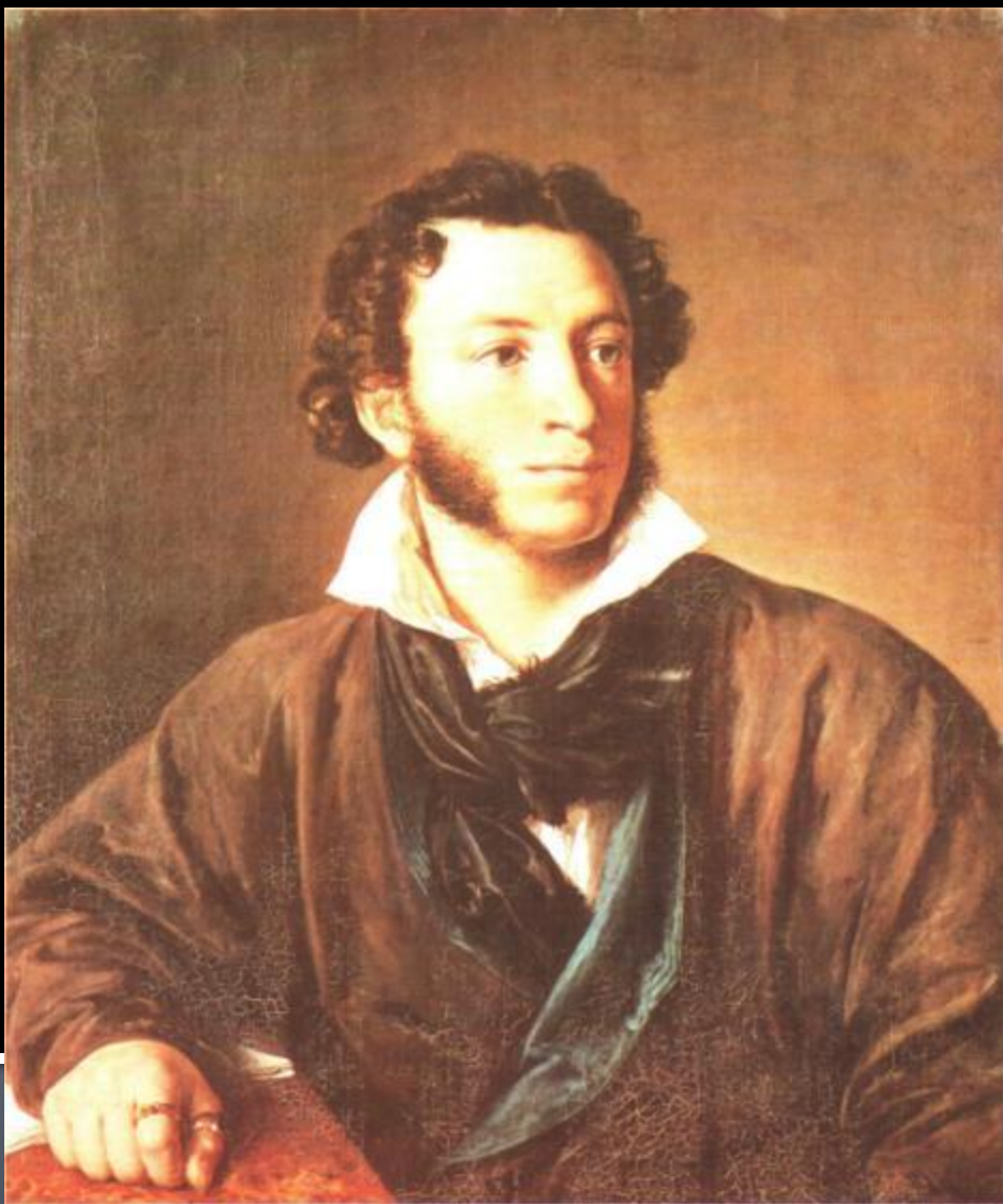
В.Тропинин.ПОРТРЕТ А. С.ПУШКИНА